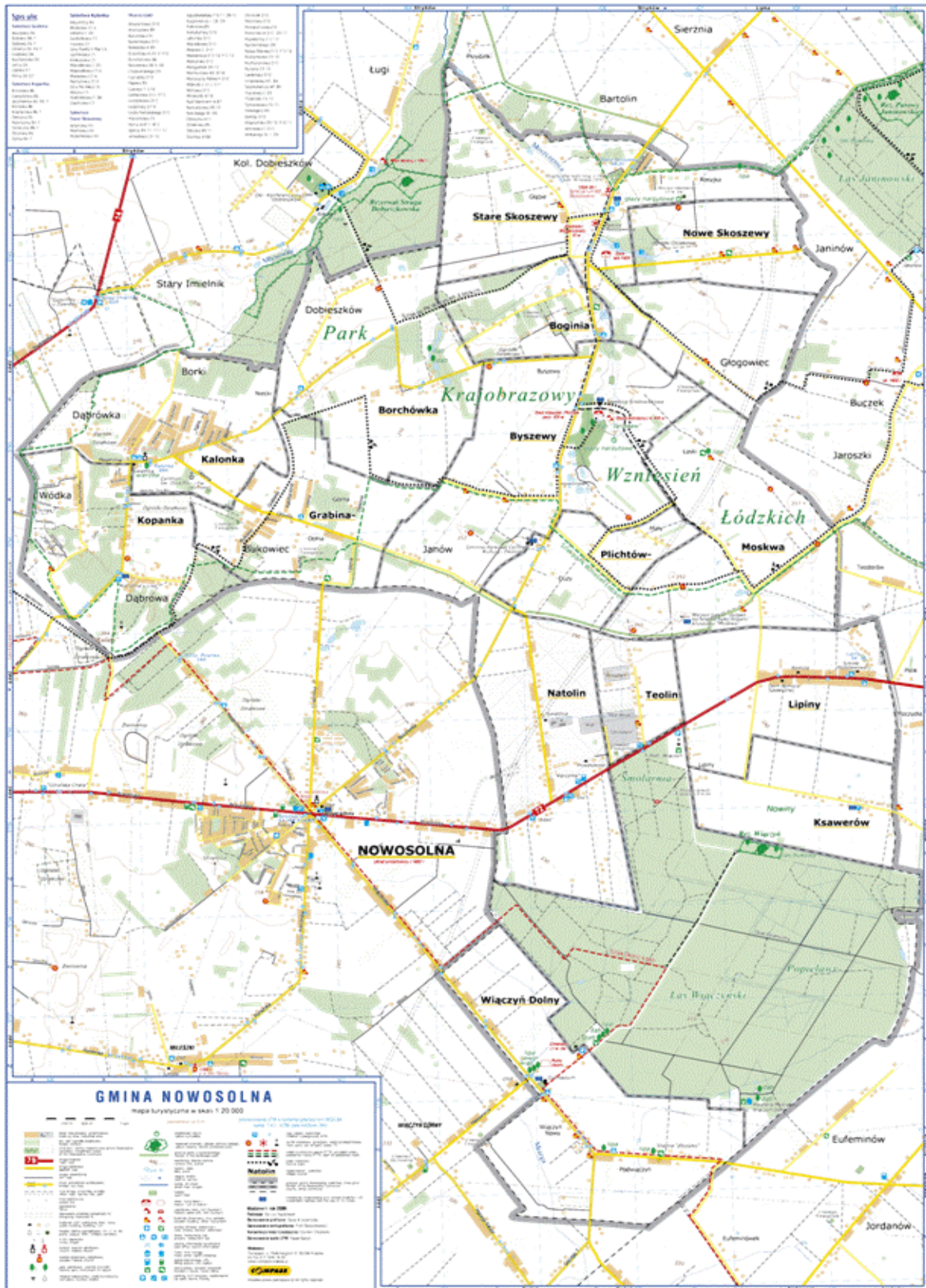
Mapa Gminy Nowosolna