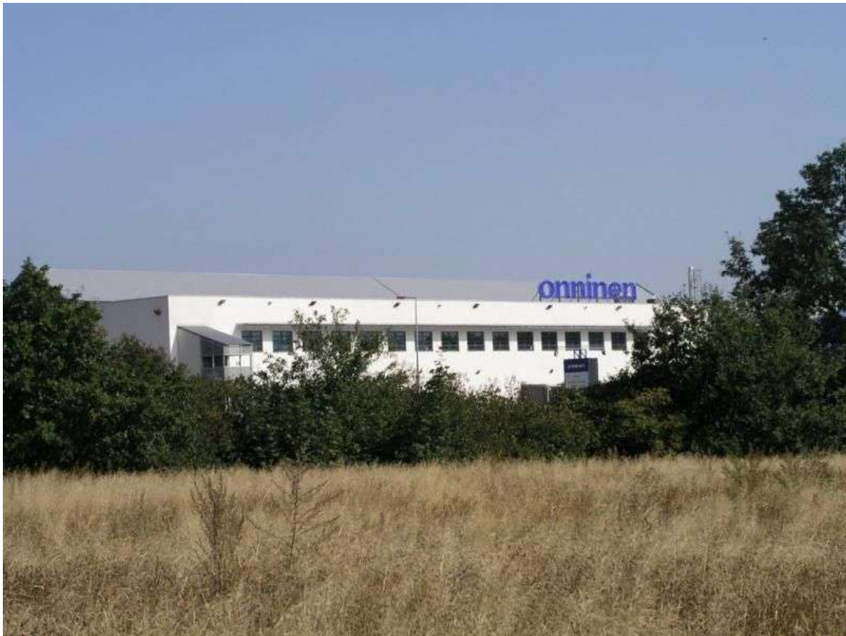
Centrum dystrybucyjne Onninen znajdujące się na terenie sołectwa Teolin