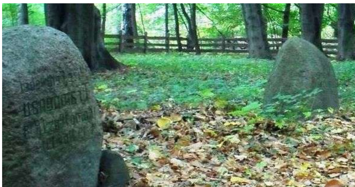
Miejsce pamięci narodowej w przyległym do wsi Lesie Wiączyńskim .