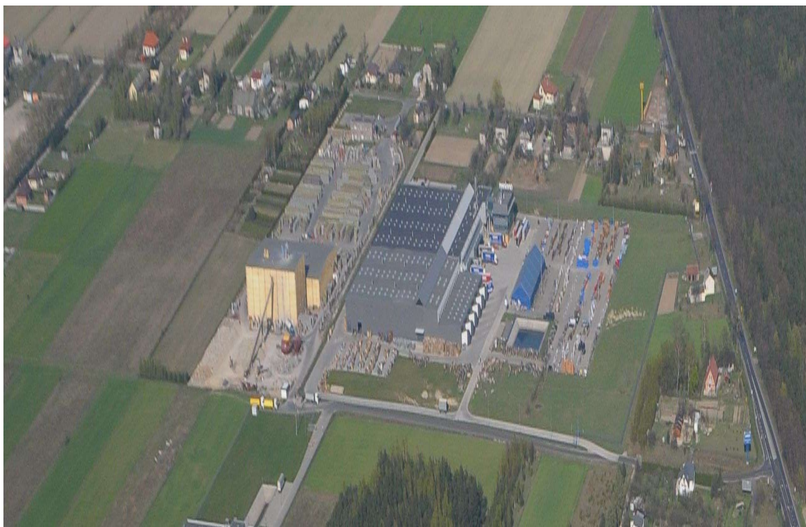
Wieś Teolin wraz z przyległą strefą przemysłową

Adres e-mail : urząd@nowosolna.gminarp.pl