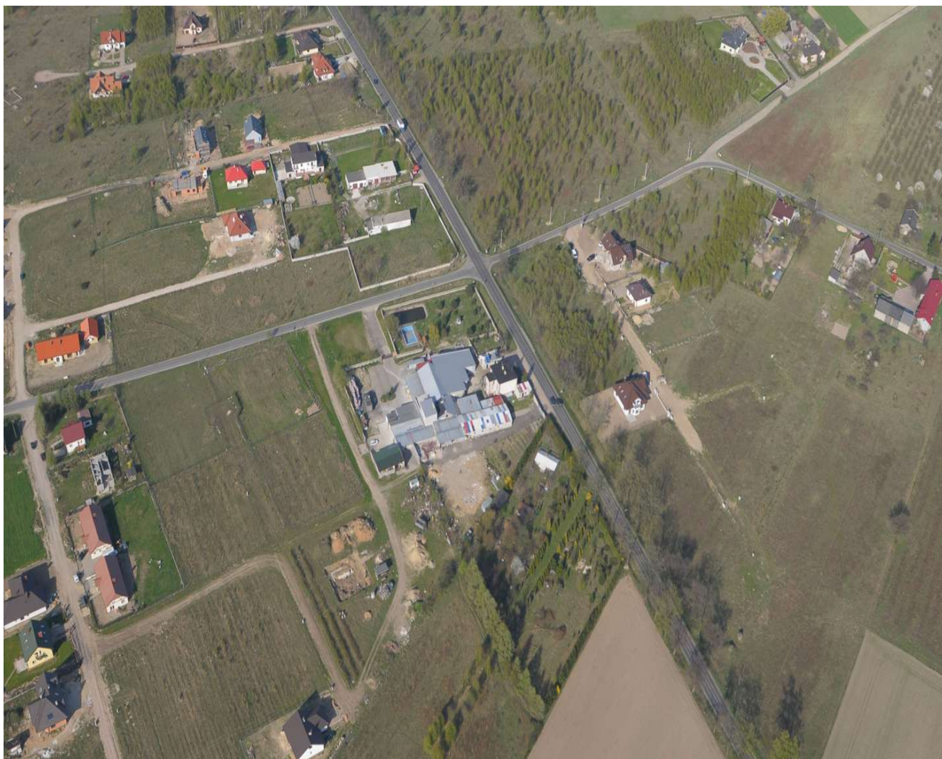
Zdjęcie lotnicze sołectwo Natolin część północna wsi.

Miejscowość powstała jako jedna z wiosek satelickich wokół głównego ośrodka o prawach miejskich jakim były w owym czasie Stare Skoszewy. Na rozwój i rozbudowę wsi duży wpływ miało, także jej położenie; przy głównej traktzie z Łodzi do Rawy Mazowieckiej. Natolin znajdował się pod zaborem rosyjskim, mimo to głównymi osadnikami byli mieszkańcy pochodzenia niemieckiego, oprócz trzech gospodarstw, które pozostały w rękach polskich według zapisów historycznych. Teren wsi Natolin był widownią i areną walk narodowowyzwoleńczych, czego świadkami są do dziś wykopywane pociski karabinowe i artyleryjskie.