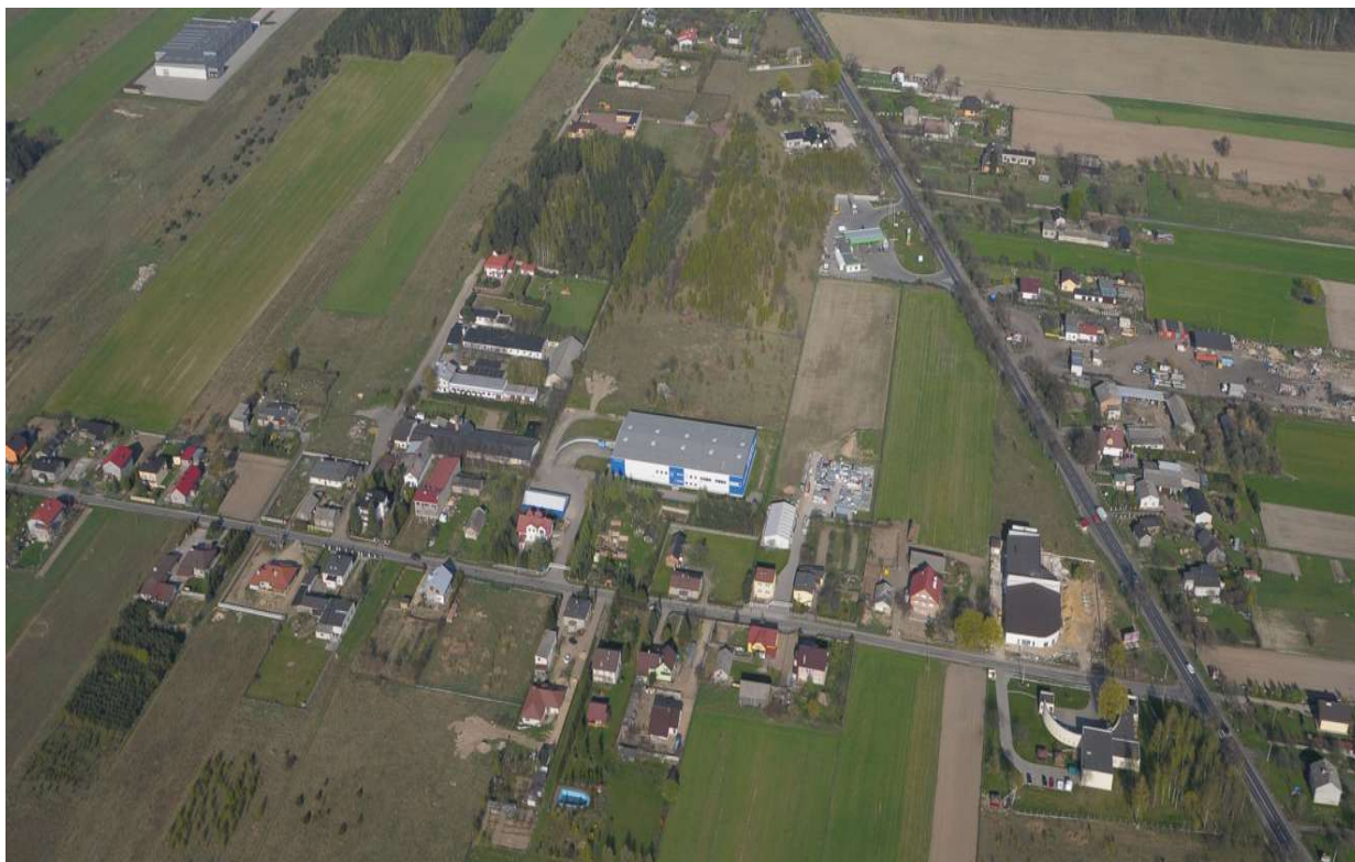
Zdjęcie lotnicze sołectwo Natolin część południowa wsi .

Stworzony Plan Odnowy Miejscowości Natolin jest narzędziem służącym programowaniu kompleksowego i długofalowego rozwoju społeczno – gospodarczego wsi Natolin.