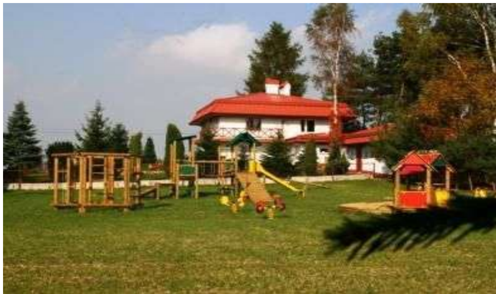
"Ekoludek" Niepubliczne Przedszkole Ekologiczne -sołectwo Natolin