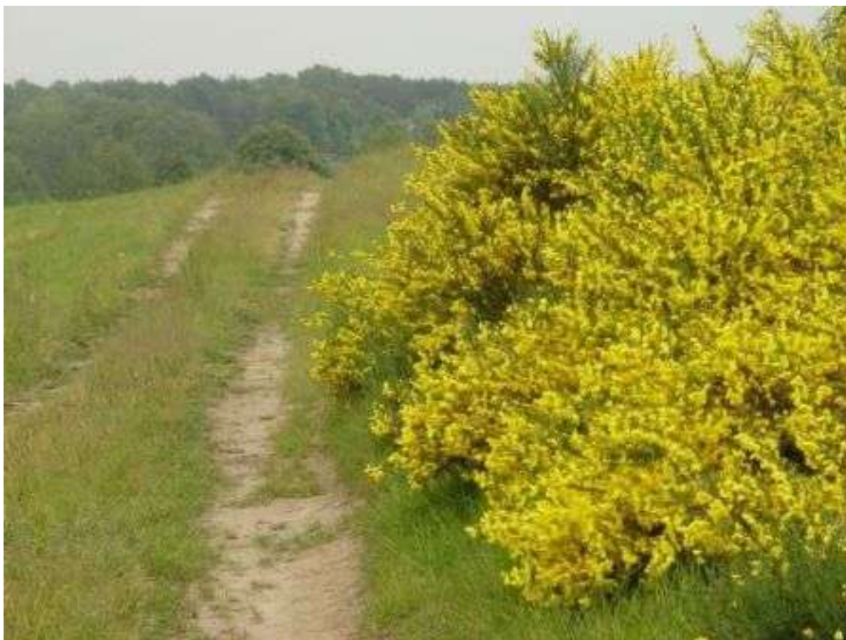
Krajobraz okolice miejscowości Dąbrowa

Na terenie sołectwa nie ma uwidoczniionych zabytków architektury czy innych obiektów uznanych za prawnie chronione. W wyniku utworzenia w 1996 roku Parku Krajobrazowego Wzniesień Łódzkich, teren sołectwa jest objęty ochroną w ramach ochrony krajobrazu, form przyrody.