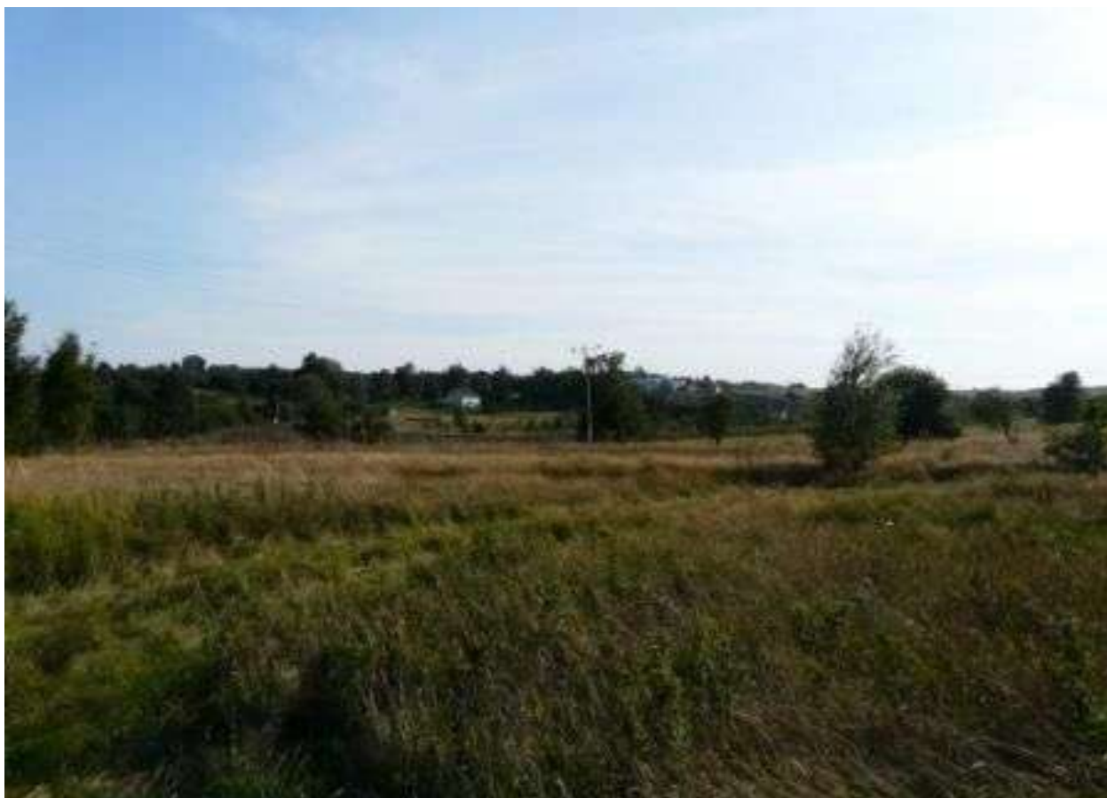
Krajobraz okolicy miejscowości Wódka