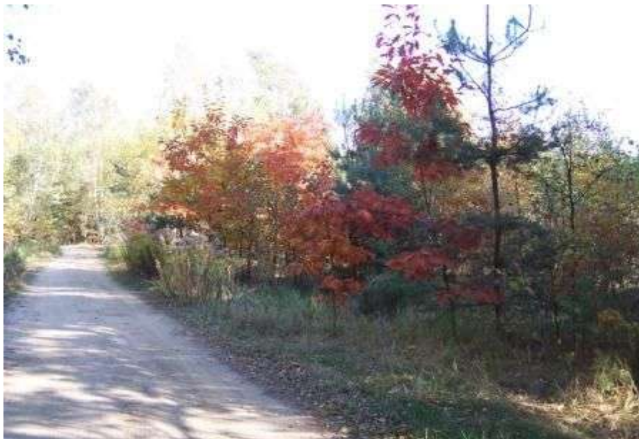
Krajobraz jesienny miejscowość Wódka