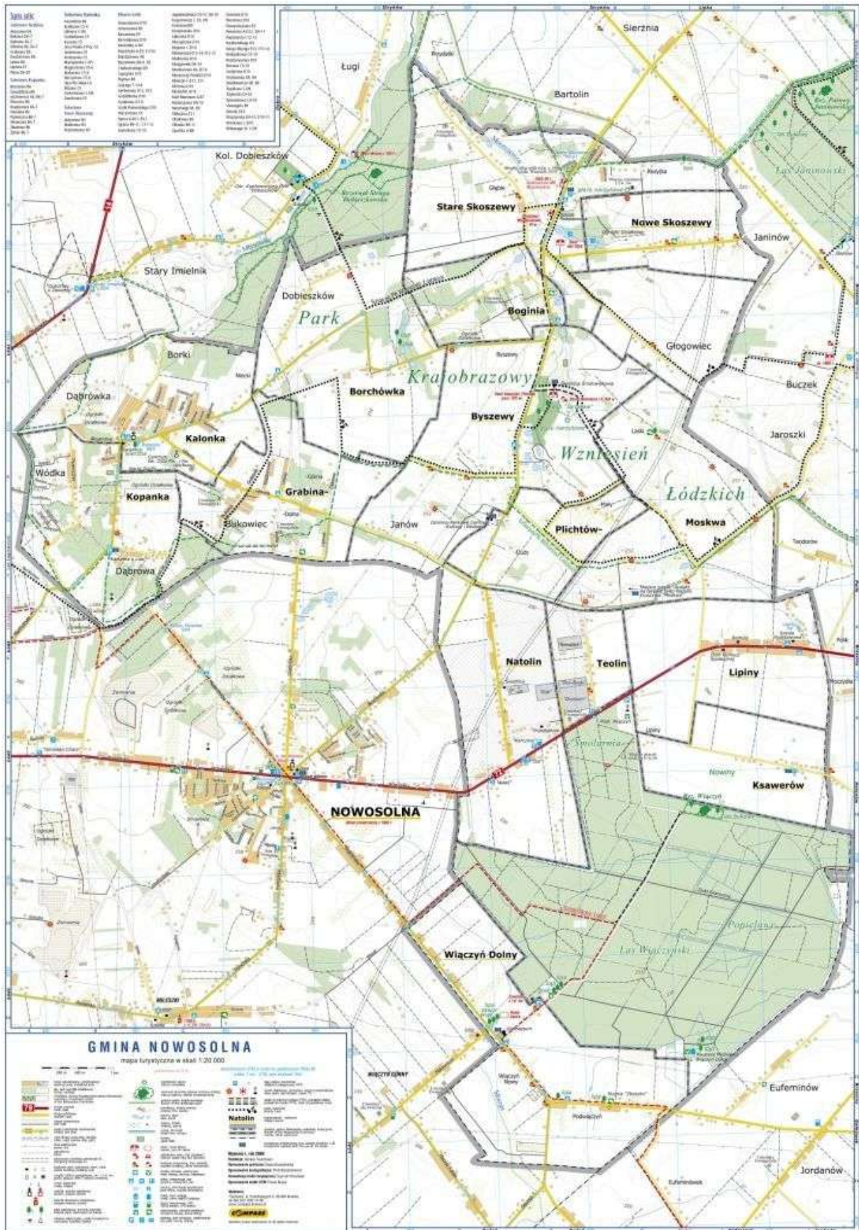
Mapa Gminy Nowosolna