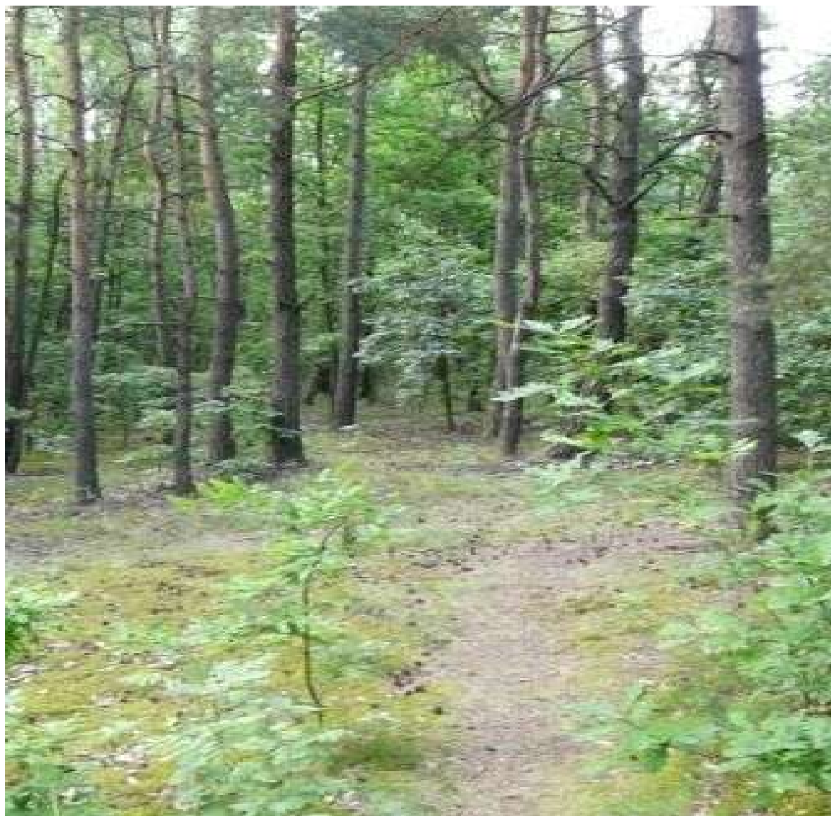
Las mieszany - sołectwo Kopanka