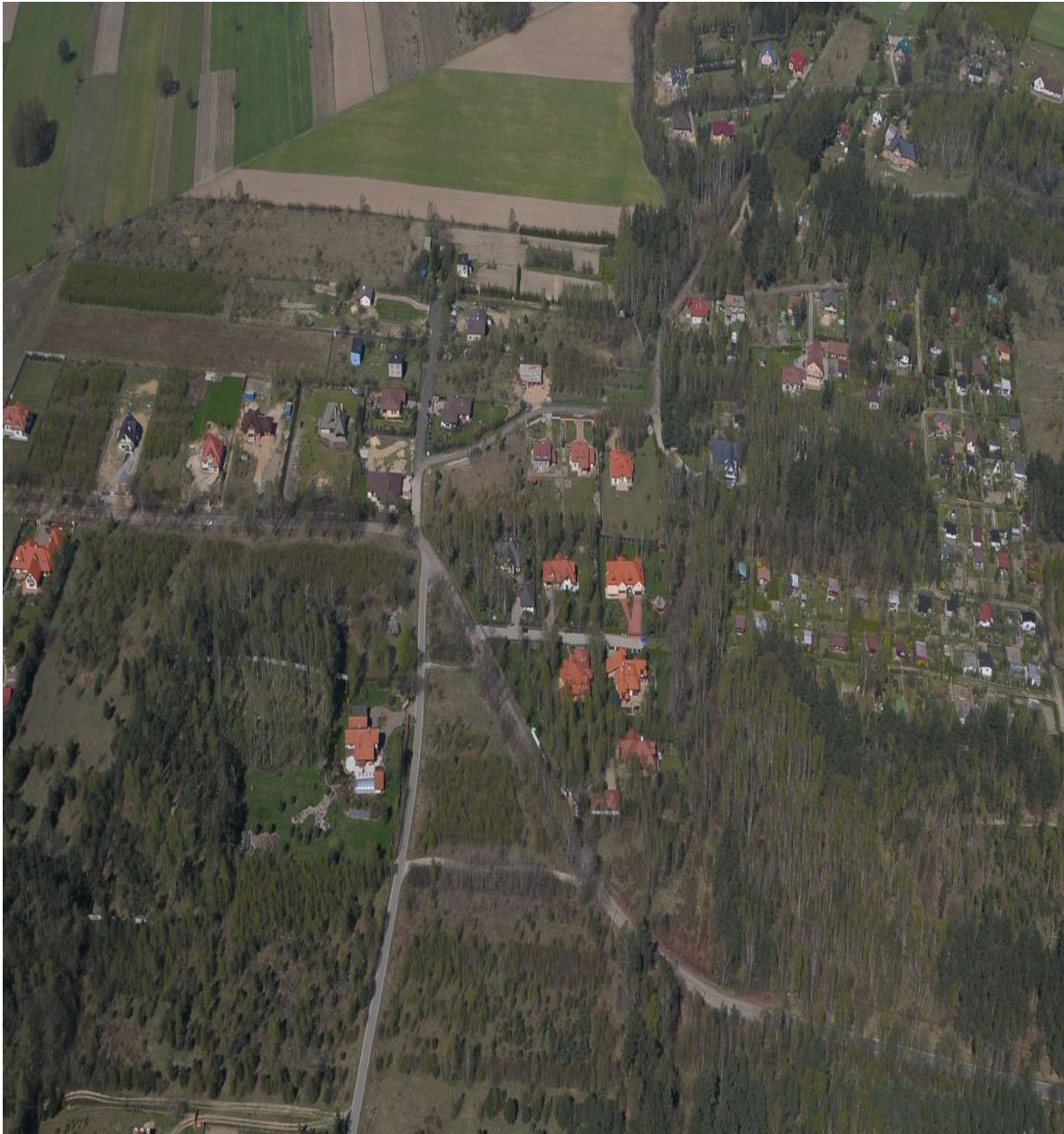
Zdjęcie lotnicze miejscowość Wódka