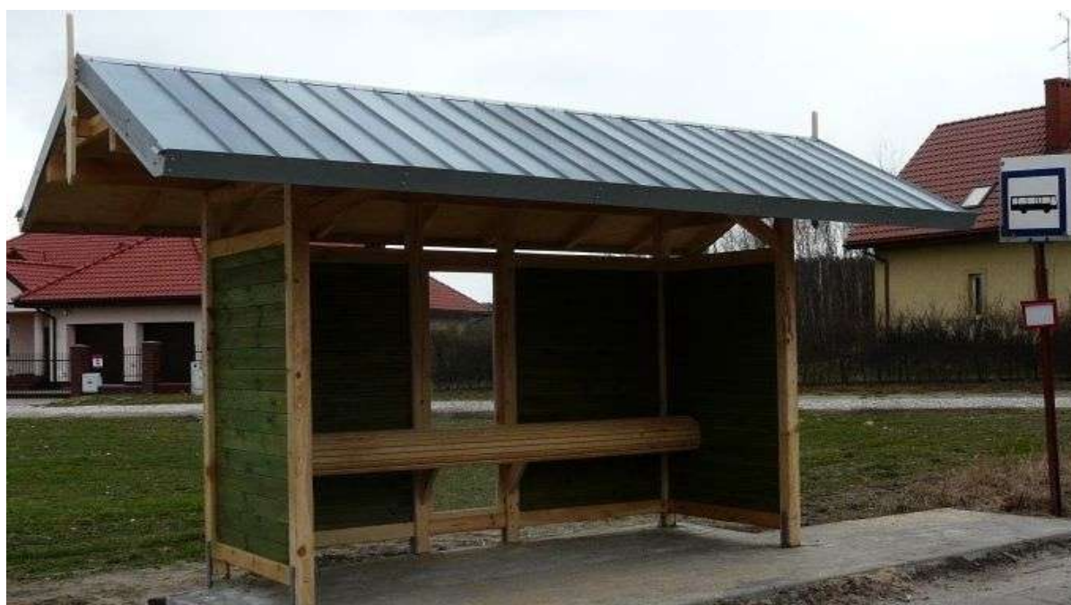
Architektura wiaty przystankowej