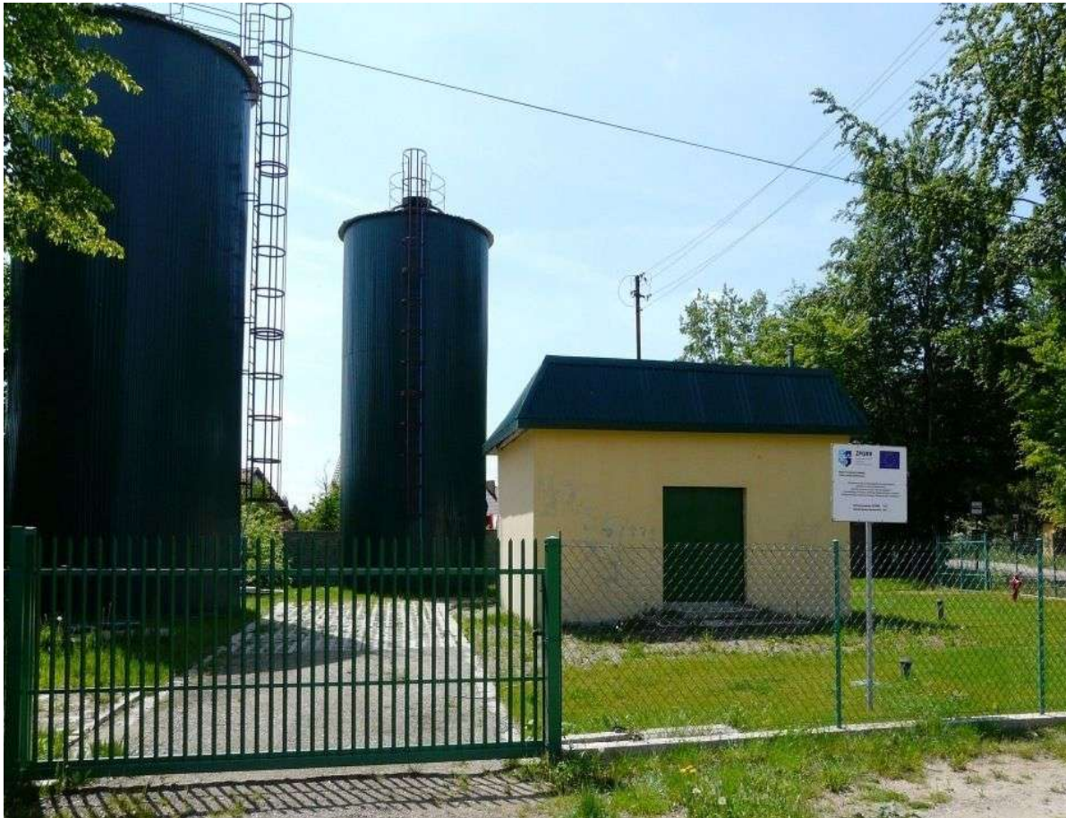
Hydrofonia w miejscowości Dąbrowa