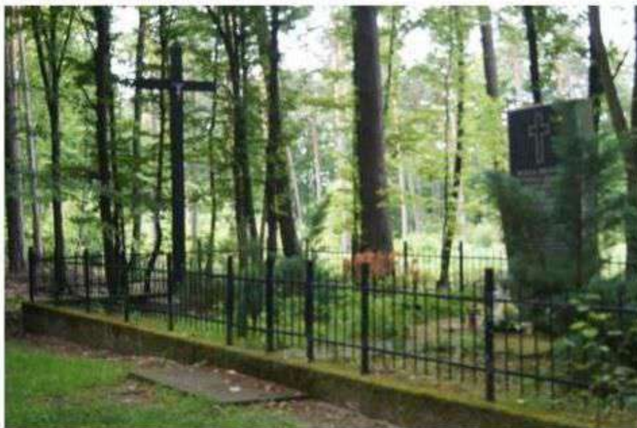
Teolin – miejsce pamięci narodowej