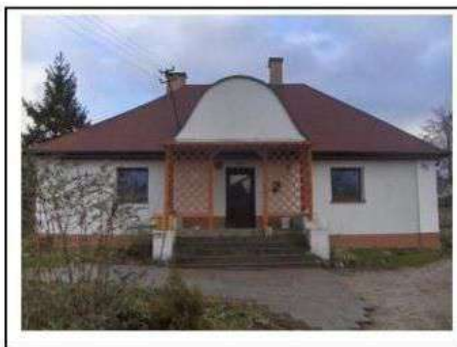
Stare Skoszewy - dwór