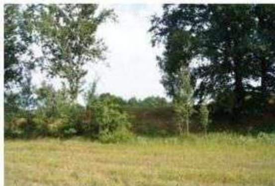
Stare Skoszewy – zabytki archeologiczne

Dzieje człowieka na terenie gminy Nowosolna, zapisane są w znaleziskach archeologicznych pochodzących już z okresu rzymskiego i wczesnego średniowiecza. Rozwój tego obszaru można podzielić na kilka wyraźnie wyodrębniających się okresów.