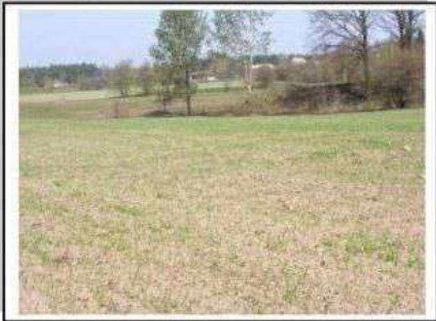
Stare Skoszewy – grodzisko