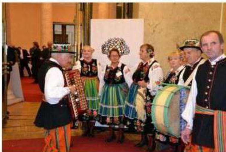
Udział zespołów w Europejskim Kongresie Gmin Wiejskich

Gminne Zespoły Śpiewacze uczestniczą w różnego rodzaju imprezach o różnym zasięgu, należy podkreślić ich udział w Europejskim Kongresie Gmin Wiejskich.