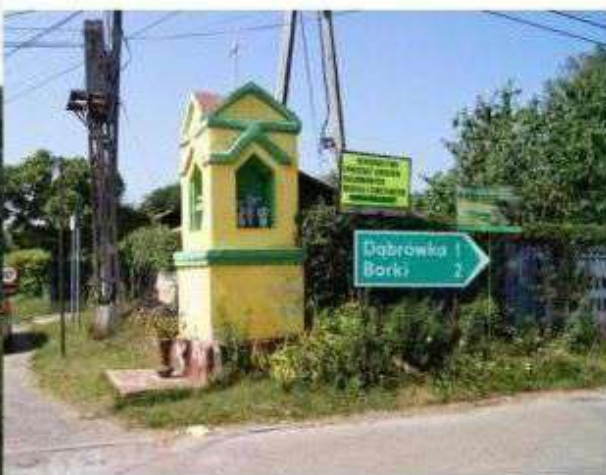
Kalonka – kapliczka