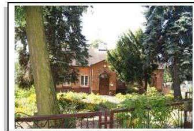
Stare Skoszewy – plebania