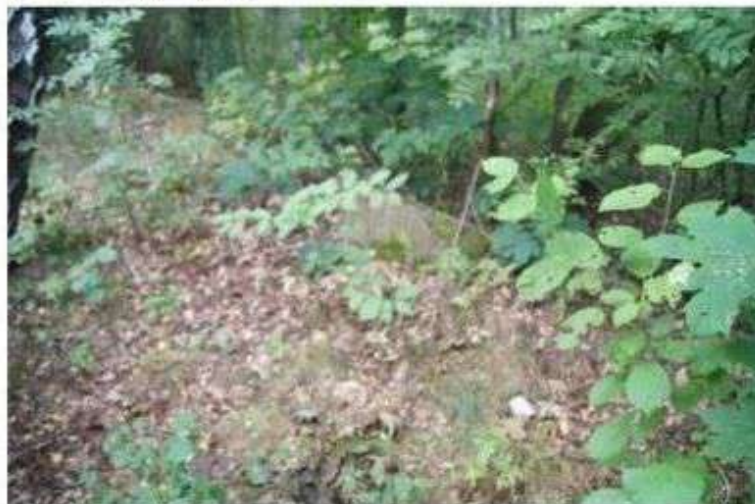
Rosyjka – cmentarz z I wojny światowej

Na terenie Gminy znajdują się też dwa zabytkowe cmentarze (niewidoczne na powierzchni) usytuowane pod i obok kościoła w Starych Skoszewach.