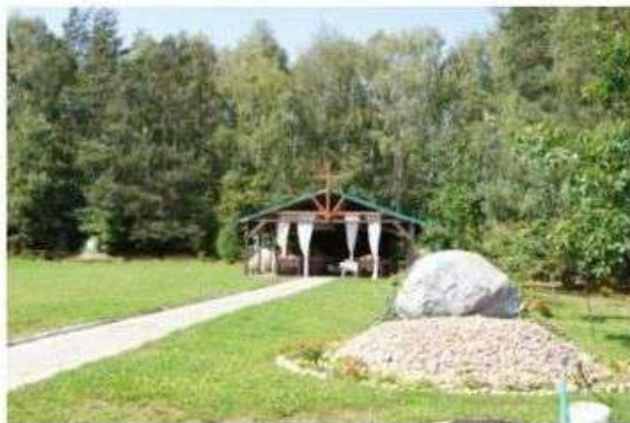
Kult głazów narzutowych w gminie Nowosolna

Jedna z nich tłumaczy mnogość głazów różnej wielkości na tym terenie niezwykłą zdolnością ziemi do "rodzenia kamieni". W rzeczywistości to proces wymarzania głazów z gruntu odpowiedzialny jest za coroczne pojawianie się nowych głazów, niewielkich rozmiarów na powierzchni ziemi. Może to nasuwać pewne skojarzenia dotyczące narodzin.