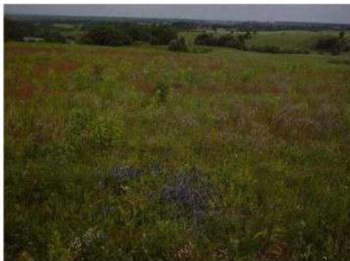
Krajobraz strefy krawędziowej wzniesień łódzkich

Gmina Nowosolna usytuowana jest w obrębie rzeźby polodowcowej Wyżyny Łódzkiej. Jest to najbliższej Łodzi położony obszar o tak zróżnicowanej rzeźbie terenu. W strefie najwyższych wysokości nachylenie zboczy sięga 20%. Najwyższy punkt Gminy znajduje się na wysokości 284 m n.p.m. w miejscowości Dąbrowa, najniższy na wysokości 150 m n.p.m. w miejscowości Stare Skoszewy.