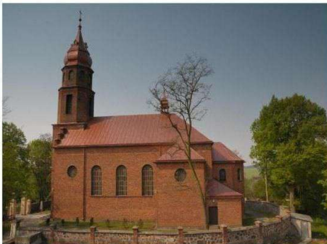
Stare Skoszewy propozycja wpisania kościoła do rejestru zabytków

Ustawa o ochronie zabytków i opiece nad zabytkami z 2003 roku w art. 74 wskazuje, że dotacje na prace konserwatorskie i roboty budowlane mogą być udzielane przez Ministra Kultury i Dziedzictwa Narodowego i Wojewódzkiego Konserwatora Zabytków tylko na zabytki wpisane do rejestru. Z uwagi na brak wpisu do niniejszego rejestru kościoła w Starych Skoszewach nie ma możliwości pozyskania finansowania na zabytki. Celowym jest wpisanie kościoła i zachowanego zabytkowego ogrodzenia do ww. rejestru zabytków.