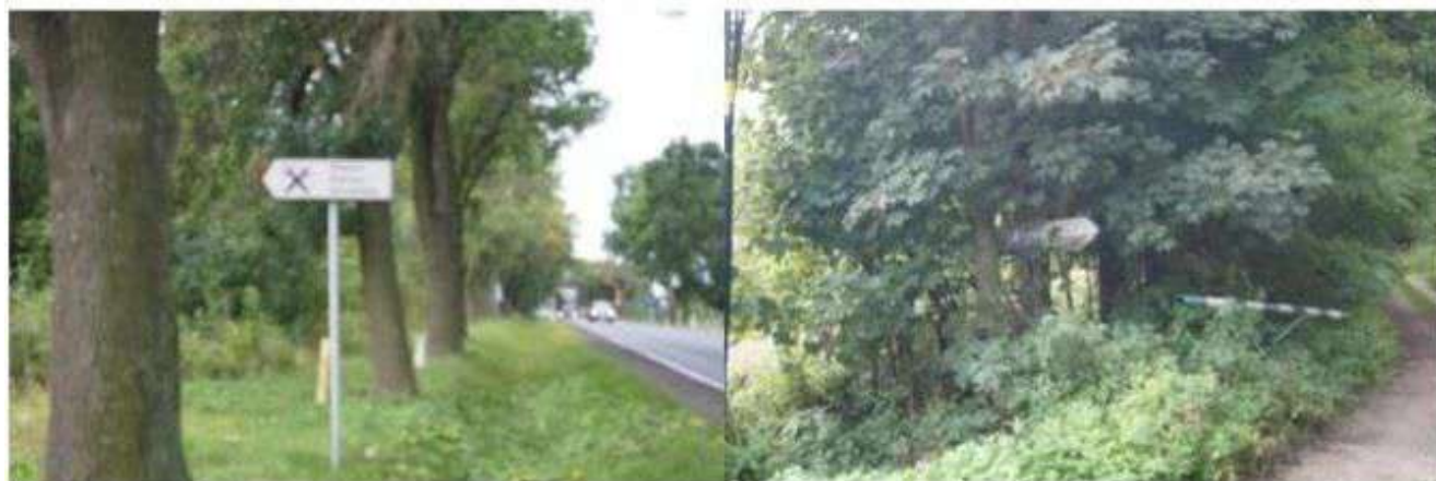
Teolin - oznakowanie miejsca pamięci

Należy podkreślić, że cmentarze i miejsca pamięci zlokalizowane na terenie gminy Nowosolna są częściowo oznakowane, w związku z tym zainteresowani ich zwiedzaniem nie mają problemu z ich odnalezieniem.