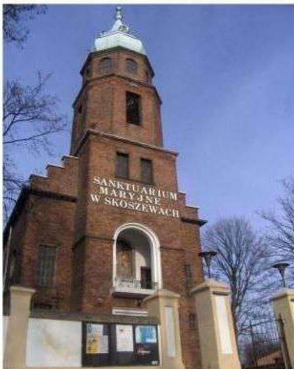
Sanktuarium w Starych Skoszewach