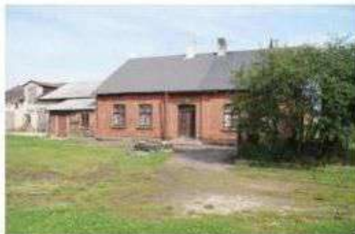
Natolin - tradycyjna zabudowa po byłych osadnikach niemieckich

Tereny gminy Nowosolna to także obszar intensywnego osadnictwa przybyszów - głównie Niemców z Europy zachodniej na początku XIX stulecia, którzy wywarli istotny wpływ na kształtowanie tradycji kulturowych i przekształcenia społeczne w dwu poprzednich stuleciach. W XIX w. powstają miejscowości: Janów, Natolin, Niecki, Nowosolna, Teolin, Boginia, Ksawerów, Nowe Skoszewy, Borki i Bukowiec oraz zostaje utworzona gmina Skoszewy (w roku 1859). Kolejne miejscowości stanowiące część gminy, tj.: Dąbrówka, Dąbrowa, Kopanka i Wódka tworzą się na początku XX wieku. Po I Wojnie Światowej w roku 1919 powstaje województwo łódzkie, w skład którego wszedł powiat brzeziński z gminą Lipiny oraz powiat łódzki z gminą Nowosolna. Okres dwudziestolecia międzywojennego to czas ciągłego rozwoju obszarów gminy. Z drugiej strony to również okres silnego odpływu mieszkańców z terenu gminy do rozwijającej się Łodzi przemysłowej.