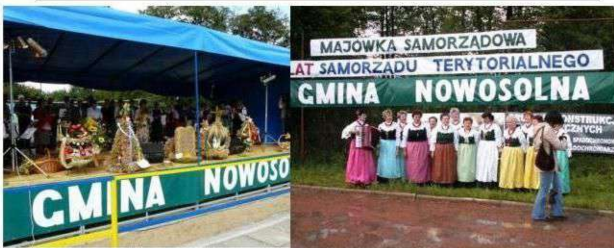
Imprezy cykliczne w gminie Nowosolna