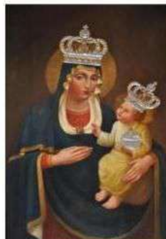
Wizerunek matki Bożej