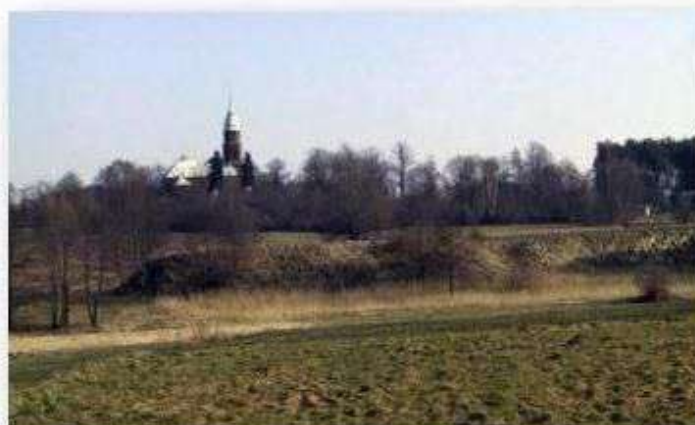
Stare Skoszewy - grodzisko w dolinie Moszczenicy (majdan)

Średniowieczne grodzisko w Starych Skoszewach uznane przez historyków za jedno z najstarszych w Polsce Środkowej. Datowane na VI w. jest jednocześnie jednym z pierwszych ośrodków władzy lokalnej i wojskowej w okresie przedpiastowskim – gród warowny. Ten zabytek jest przedmiotem badań archeologicznych prowadzonych przez Muzeum Archeologiczne i Etnograficzne w Łodzi. Gród zamieszkiwany był w okresie plemiennym, najprawdopodobniej przez Wiślan a później przez Polan, od VI w. do początku IX w., do czasu zniszczenia przez pożar. Założyciele osady warownej wykorzystali występujące na tym terenie dogodne warunki naturalne: strome nadrzecze, bagnisty brzeg i naturalne źródło wody. Gród miał kształt elipsy o powierzchni 1 ha. Dostępu do jego wnętrza bronił wał drewniano-ziemny o wysokości 4 m, szerokości u podstawy 12 m i długości 105 m. U wierzchołka wału znajdowały się drewniane flanki i obronne płoty. Niniejsze założenie konstrukcyjne zachowało się do naszych czasów w dobrym stanie.