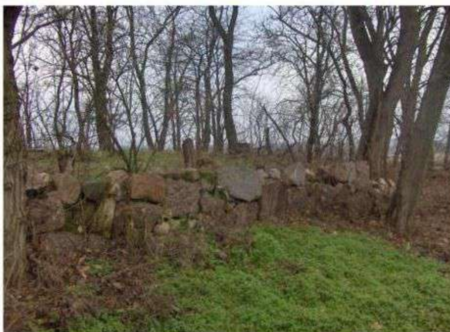
Głogowiec – cmentarz ewangelicki