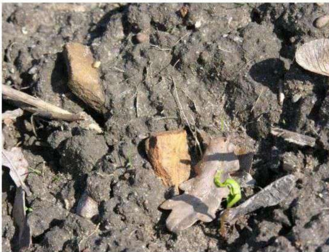
Stare Skoszewy – ceramika w orce pochodząca ze stanowiska archeologicznego

Dla wyżej zamieszczonych stanowisk archeologicznych należy wyznaczyć strefy ochrony archeologicznej na etapie sporządzania aktów prawa miejscowego.