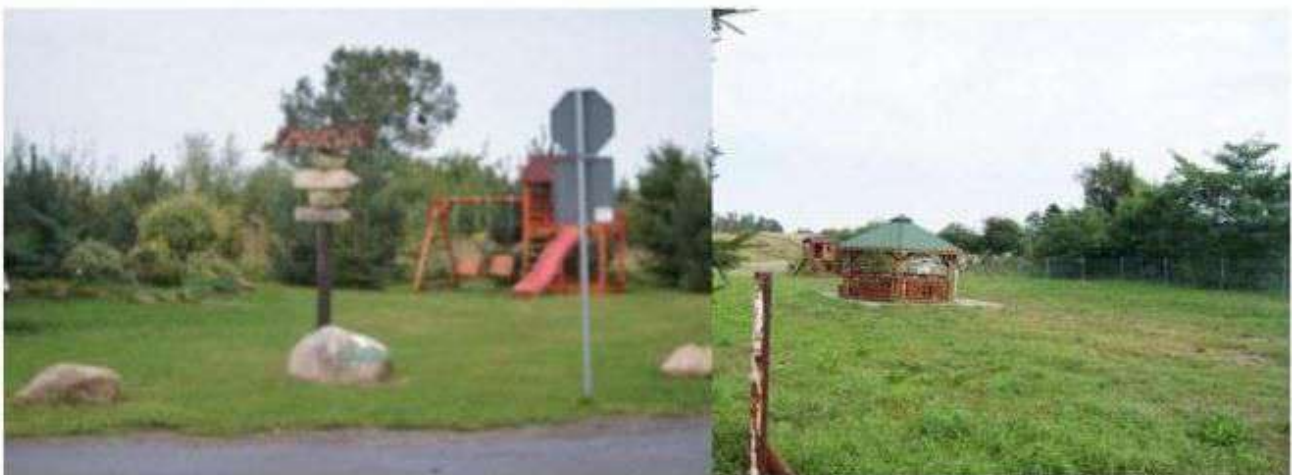
Obszary integracji mieszkańców w Moskiewie i Nowych Skoszewach

W wyżej wymienionych ośrodkach wiejskich zachowała się zabudowa drewniana , która ze względu na nietrwałość budulca z jakiego jest wykonana powinna zostać objęta szczególną opieką. Do najcenniejszych zidentyfikowanych domów drewnianych na terenie gminy zakwalifikowano: domy 35 i 41 w miejscowości Wiańczyr Dolny.