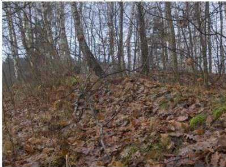
Boginia – cmentarz ewangelicki