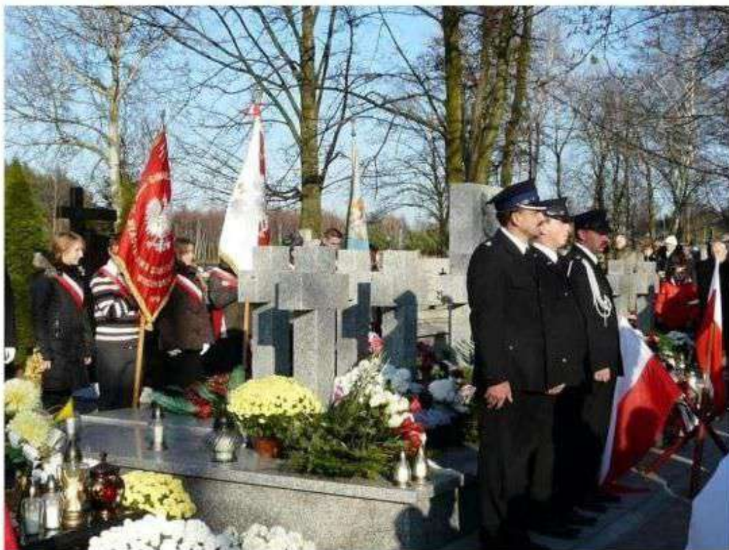
Organizacja imprez związanych z miejscem bitew

W ostatnich latach imprezy upamiętniające wydarzenia historyczne cieszą się bardzo dużym powodzeniem. Nasycenie miejsc związanych z toczącymi się starciami na przełomie listopada i grudnia 1914 roku podczas Bitwy Brzezińskiej. Pamiątki historycznych tragicznych walk m. in. w Starych Skoszewach i Wiączyniu Dolnym mogą stanowić miejsca rekonstrukcji wydarzeń historycznych.