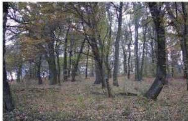
Park dworski w Byszewach