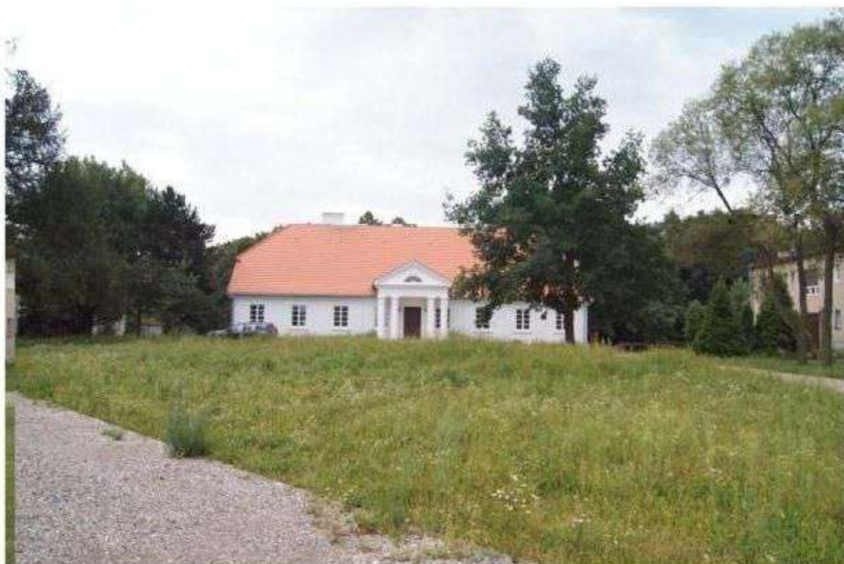
Wyremontowany dwór w Byszewach

Na etapie sporządzania wojewódzkiego programu opieki nad zabytkami dla województwa łódzkiego wytypowano obiekty uznane za reprezentatywne. Wyremontowany obiekt dworu w Byszewach stanowi dobrą kandydaturą do zamieszczenia na tej liście w kolejnej edycji dokumentu. Obiekty i obszary zamieszczone na liście obiektów reprezentatywnych są brane pod uwagę przy ocenianiu wniosków złożonych do Urzędu Marszałkowskiego w Łodzi przy ubieganiu się o środki przyznawane na rewaloryzację zabytków. Działania promocyjne powinny przede wszystkim lokować Byszewy wśród atrakcyjnych zabytków.