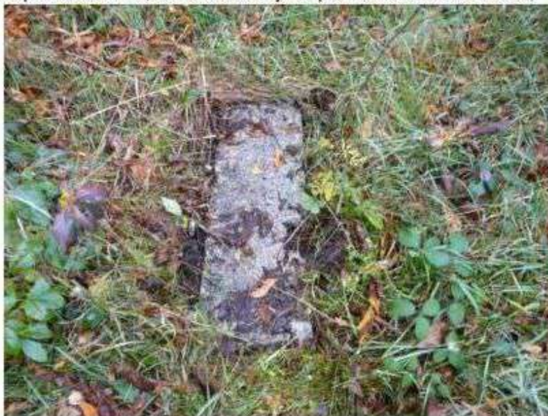
Bukowiec – cmentarz ewangelicki