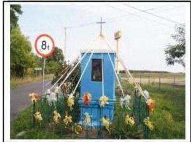
Teolin - kapliczka