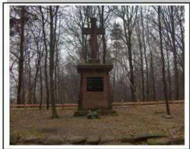
Wiączyń Dolny – cmentarz wojenny