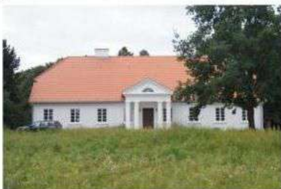
Byszewy – dwór po remoncie