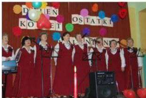
Zespół śpiewaczy Seniorki z Kalonki

Na obszarze gminy Nowosolna organizowane są liczne imprezy kulturalne, ukierunkowane na zachowanie tożsamości oraz integrację mieszkańców. Oprócz festynów, majówek samorządowych, odbywają się również konkursy dla dzieci, występy zespołów folklorystycznych. Na terenie gminy Nowosolna działają trzy zespoły śpiewacze – Seniorki z Kalonki, Wiączynianka i Byszewianie. Od roku 1918 na terenie gminy prężnie działa orkiestra parafialna ze Starych Skoszew.