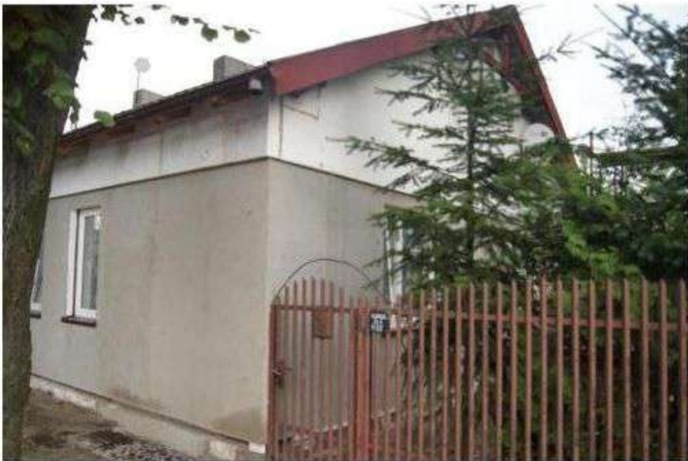
Wiączyń Doły - ocieplany dom drewniany, który wyeliminowano z gminnej ewidencji zabytków opracowanej 2007 r.

Część domów drewnianych znajduje się w złym stanie technicznym i ze względu na widoczną presję urbanistyczną znikną z krajobrazu gminy. Niektóre z nich są przekształcane poprzez ocieplanie i przebudowę.