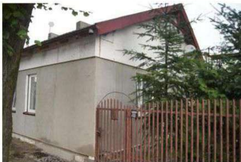
Ocieplony dom Wiączyń Dolny nr 43