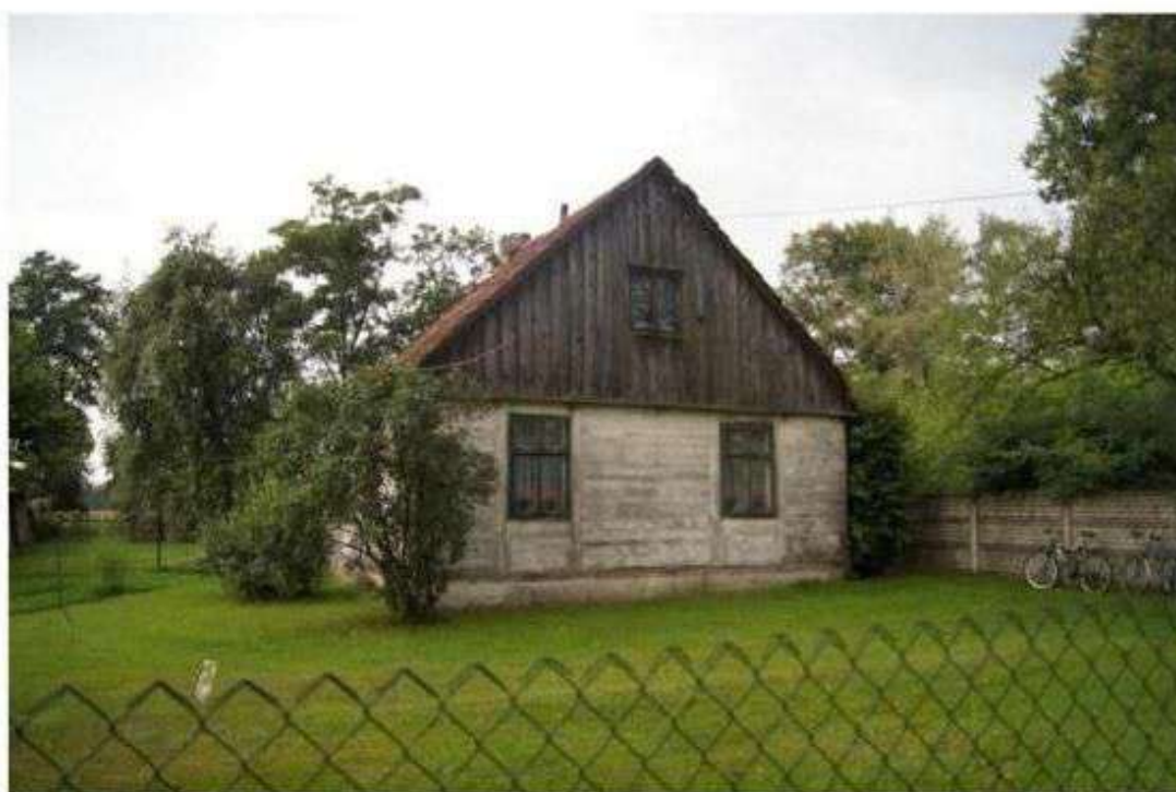
Wiaczyri Dolny dom nr 41