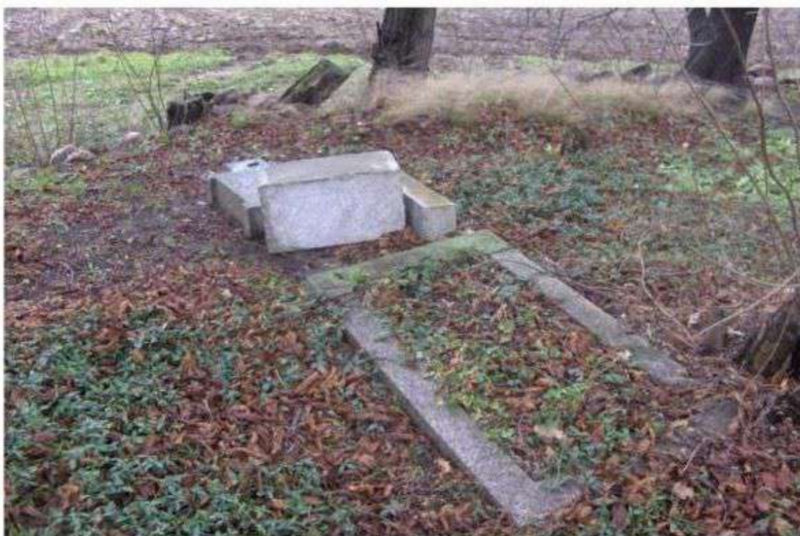
Obszary cmentarzy przeznaczone do rewaloryzacji

Obszary zabytkowych cmentarzy z terenu gminy Nowosolna mogą ubiegać się dofinansowanie z Funduszu Ochrony Środowiska i Gospodarki Wodnej na rewaloryzację zabytkowych obszarów. Cmentarze ewangelickie zamieszczone w Gminnej ewidencji zabytków gminy Nowosolna powinny kandydować do pozyskania środków na przeprowadzenie prac rewaloryzacyjnych. Wiąże się to z pozyskaniem funduszy na przeprowadzenie działań konserwatorskich mających na celu ekspozycję zachowanego dziedzictwa kulturowego.