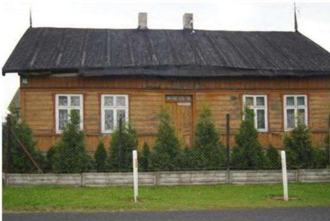
Wiaczyri Dolny dom nr 35