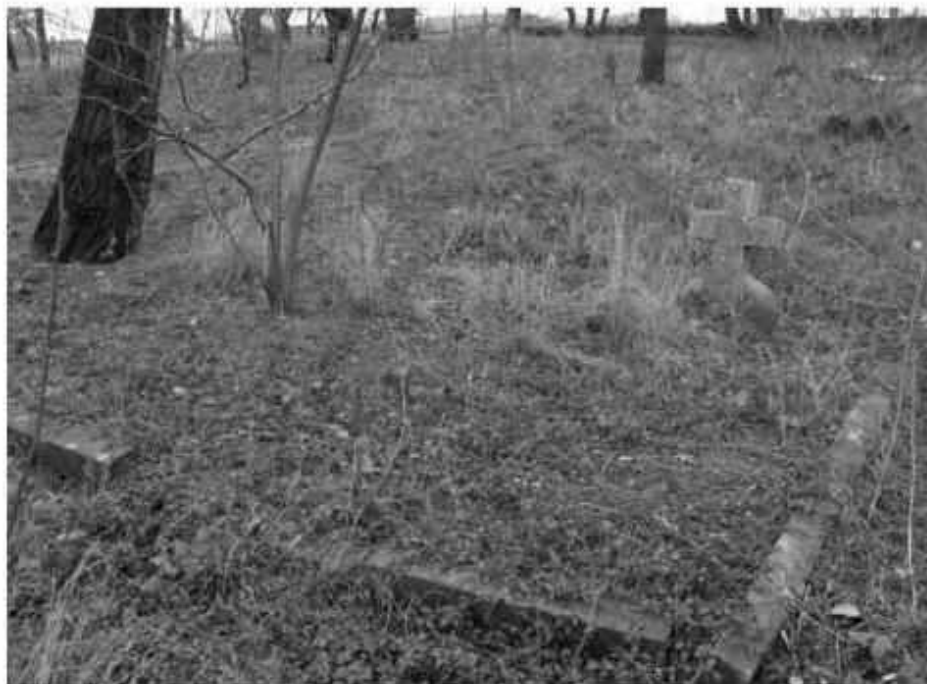
Głogowiec – cmentarz ewangelicki

Obecnie jest to widoczne z drogi, położone na lekkim wzniesieniu, częściowo ogrodzone kamiennym murkiem zabytkowe założenie cmentarne, z mogiłami porośniętymi trawą.