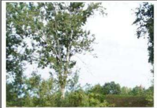
Stare Skoszewy - grodzisko