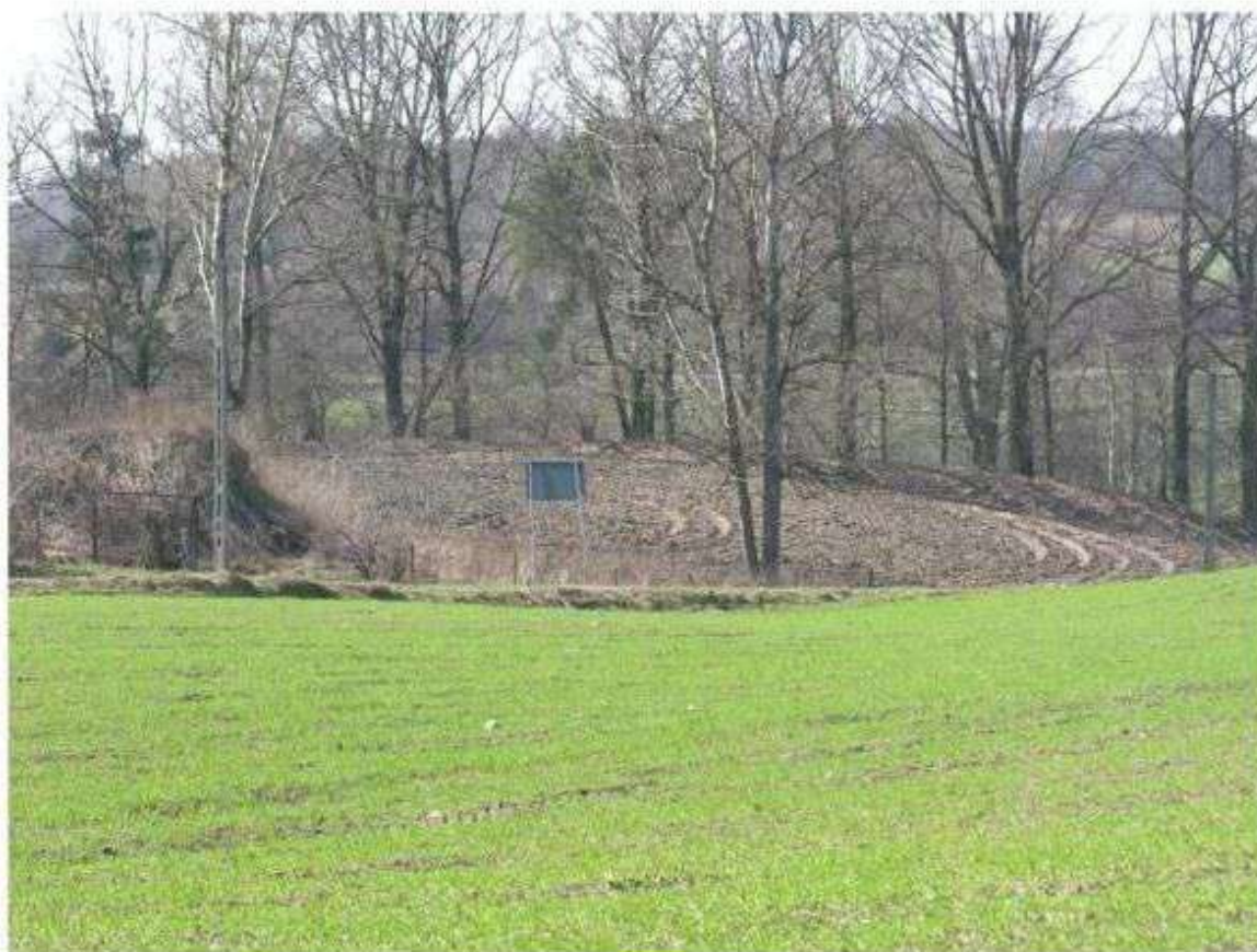
Grodzisko w Starych Skoszewach do zagospodarowania na cele turystyczno – administracyjne

W tym celu zostaną wykonane: zdjęcia lotnicze terenu osady i grodziska w różnych warunkach pogodowych i wegetacyjnych tak, aby uzyskać jak najlepsze zdjęcia do analizy archeologicznej z aktualnym stanem zachowania obiektu. Na osadzie zostaną wykonane badania nieinwazyjne oraz odwierty metodami geologicznymi w celu rozpoznania faktycznego zasięgu osady. Koncepcja zagospodarowania terenu na potrzeby administracyjno – turystyczne gminy Nowosolna powinna uwzględniać wyniki wstępnego rozpoznania archeologicznego oraz nawiązywać do dawnego budownictwa tych terenów: użycie tradycyjnych materiałów (najlepiej drewna, kamienia lub materiałów łączonych), dostosowanie wielkości budynków do tradycyjnych form oraz zagospodarowanie przestrzeni publicznej (np. parkingów) w taki sposób, aby jak najmniej terenu uległo nieodwracalnemu przekształceniu.