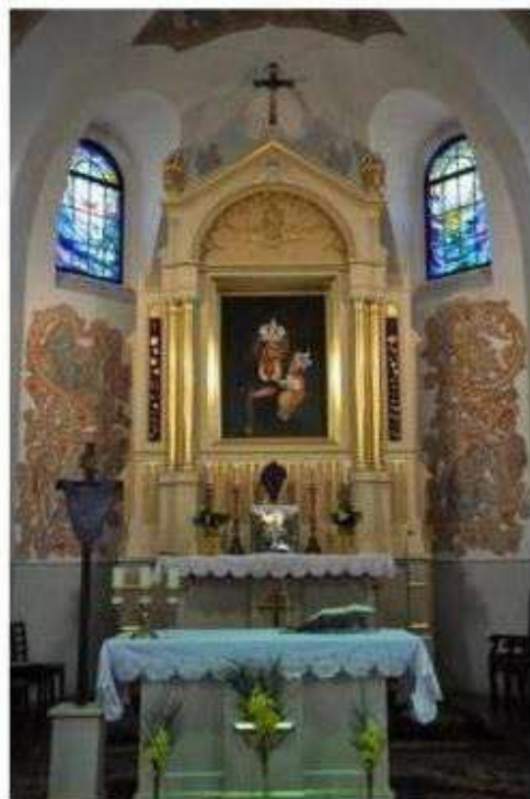
Kopia cudownego obrazu