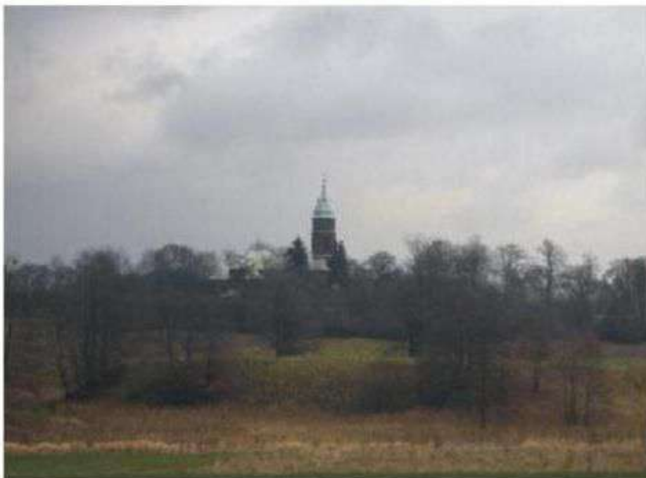
Widok na stanowisko archeologiczne nr 2 – Stare Skoszewy