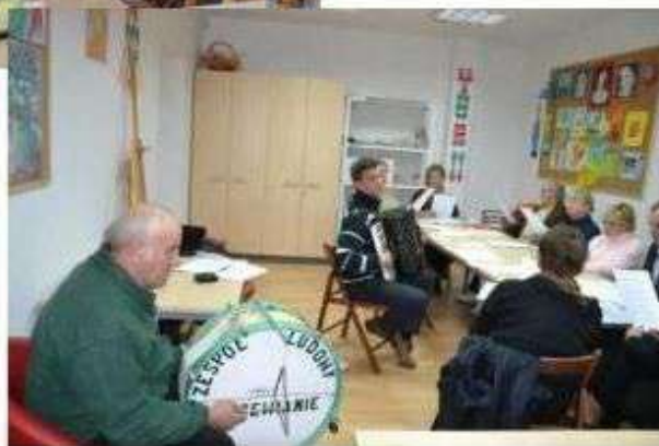
Promowanie dziedzictwa w Gminnym Centrum Kultury i Ekologii w Plichtowie