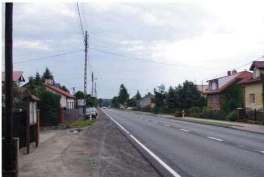
Przebieg drogi 72 w miejscowości Lipiny

Przez teren Gminy przebiega droga krajowa nr 72 relacji Łódź – Rawa Mazowiecka prowadząca do drogi szybkiego ruchu Warszawa – Katowice. Przebiegać ma też autostrada A-1 północ – południe, w której we wsi Natolin projektowany jest zjazd do ww. drogi krajowej nr 72.