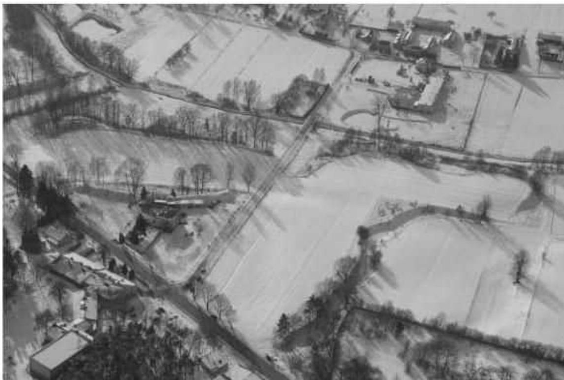
Stare Skoszewy - widok na grodzisko i osadę

i dnia 4 kwietnia 1988 r. pod nr A/214 (zasięg wpisu do rejestru określono w załączniku graficznym (powierzchnia objęta wpisem do rejestru około 3,5 ha; powierzchnia grodziska bez urządzeń towarzyszących około 1,8 ha).