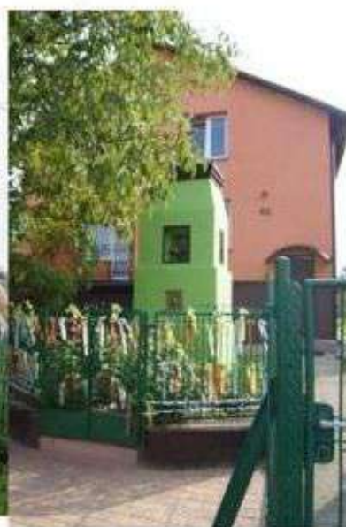
Natolin – kapliczka