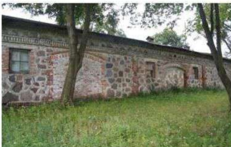
Upowszechnianie legendy związanej z występowaniem głazów narzutowych z terenu gminy Nowosolna