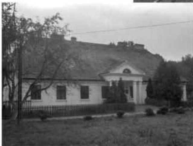
dwór przed remontem