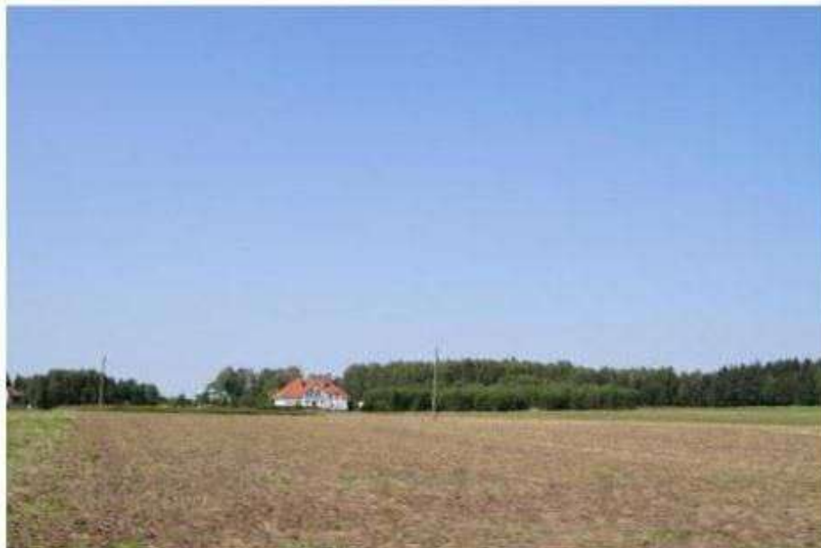
Budownictwo rezydencjalne w obrębie Parku Krajobrazowego Wzniesień Łódzkich

Przez teren Gminy przebiega droga krajowa nr 72 relacji Łódź – Rawa Mazowiecka prowadząca do drogi szybkiego ruchu Warszawa – Katowice. Przebiegać ma też autostrada A-1 północ – południe, w której we wsi Natolin projektowany jest zjazd do ww. drogi krajowej nr 72.