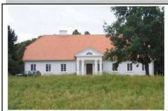
Byszewy - dwór