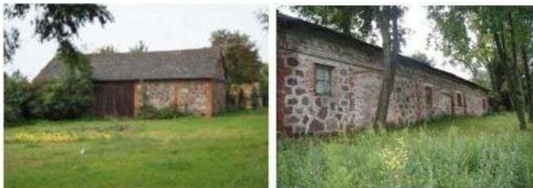
obora w Moskwie i stajnia w Byszewach - głazy narzutowe wykorzystywane do konstrukcji ścian

W elementach dziedzictwa kulturowego mieszkańców gminy ważną rolę odgrywają głazy narzutowe, stanowiące tradycyjny materiał budowlany wykorzystywany do konstrukcji ścian budynków gospodarczych oraz ogrodzeń. Stanowią one tradycyjny element krajobrazu kulturowego gminy i bogactwo kultury niematerialnej, gdyż stały się źródłem miejscowych – regionalnych podań i legend.