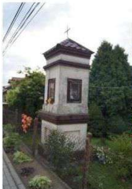
Lipiny – kapliczka

Wśród krajobrazu kulturowego gminy Nowosolna walorem dziedzictwa są liczne kapliczki przydrożne występujące m. in. w: Kaloncy (przy drodze na Dąbrówkę oraz przy kaplicy p.w. Św. Ojca Pio), Lipinach, Natolinie, Teolinie, Plichtowie, Wiączyniu Dolnym, Dobieszkowie. Niektóre z nich posiadają zabytkowy charakter np. w Natolinie, Kaloncy (przy drodze na Dąbrówkę), Teolinie, Plichtowie, Dobieszkowie i Wiączyniu Dolnym, inne są bardziej współczesne, jak w Kaloncy (przy kaplicy).