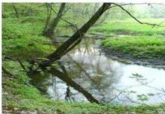
Byszewy - źródła rzeki Moszczenicy

Ziemie leżące obecnie w granicach administracyjnych gminy Nowosolna w przeszłości pokrywały lasy, którym towarzyszyły cieki rzeczne. Na terenie tym, wśród lasów Puszczy Łódzkiej od późnego średniowiecza lokalizowano osady.