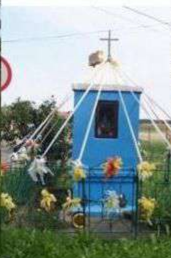
Teolin – kapliczka