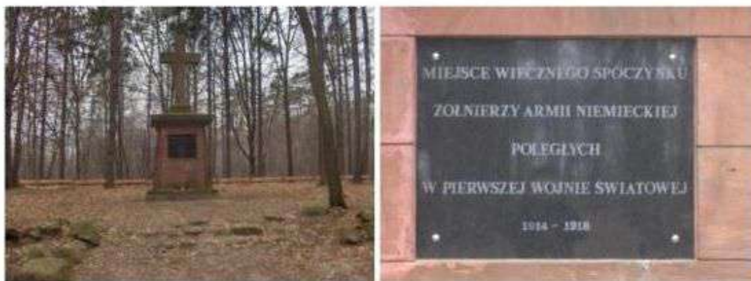
Włóczyna Dolny – cmentarz z I wojny światowej

Wydarzeniem, które miało miejsce na omawianym obszarze była również tocząca się na przełomie listopada i grudnia 1914 roku Bitwa pod Łodzią (w historiografii niemieckiej bitwa nazwana „bitwą pod Brzezunami”). Gmina Nowosolna stała się obszarem najcięższych walk „operacji łódzkiej”, związanych z nią przełomów i rozstrzygnięć. W czasie dwumiesięcznych walk zniszczeniu uległo wiele wsi. W wyniku ostrzału przez rosyjską artylerię spłonął kościół modrzewiowy w Starych Skoszewach. W walkach życie straciło tysiące żołnierzy polskich i rosyjskich. Pamiątką historyczną tragicznych walk z okresu I Wojny Światowej są cmentarze wojenne zlokalizowane m. in. w Starych Skoszewach (Rosyjka) i Włóczynie Dolnym.