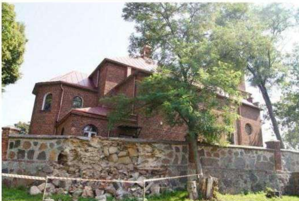
Konieczność poprawy stanu obiektów i obszarów zamieszczonych w Gminnej ewidencji zabytków gminy Nowosolna

Należy dokonać wszelkich starań, by doprowadzić do poprawy stanu obiektów zamieszczonych w gminnej ewidencji zabytków. Istnieje jednak bariera natury prawnej na drodze pozyskiwania środków finansowych na przeprowadzenie remontów, ponieważ ustawa stanowi, że finansowane są prace remontowe obiektów wpisanych do rejestru. Obiekty nie objęte prawną formą ochrony tzw. ewidencjonowane mogą uzyskać dofinansowanie jedynie w przypadku opracowania projektu kompleksowej odnowy ze środków dysponowanych przez Urząd Marszałkowski w Łodzi lub z Funduszu Rozwoju Obszarów Wiejskich i Wojewódzkiego Funduszu Ochrony Środowiska i Gospodarki Wodnej.