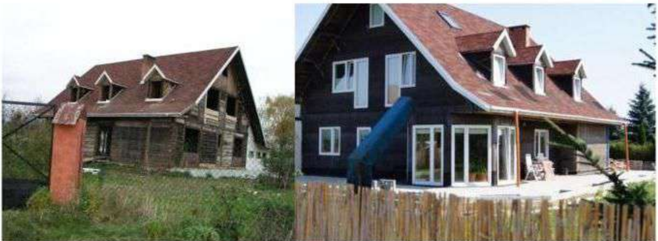
Kalotka – przebudowany dom drewniany