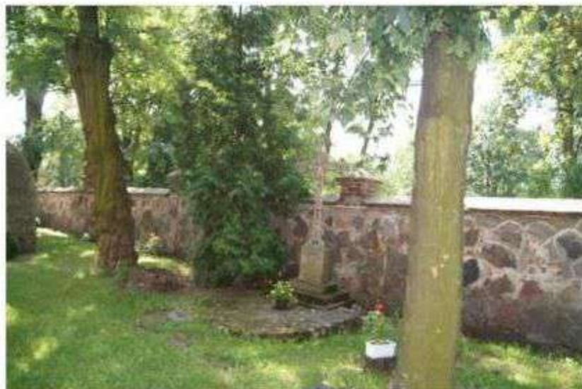
Stare Skoszewy - Grób Plichtów

Pierwszy posiada pogańskie urny z V wieku przed Chrystusem, drugi z XVI-XVIII wieku zawarty jest w obrębie murów otaczających kościół.