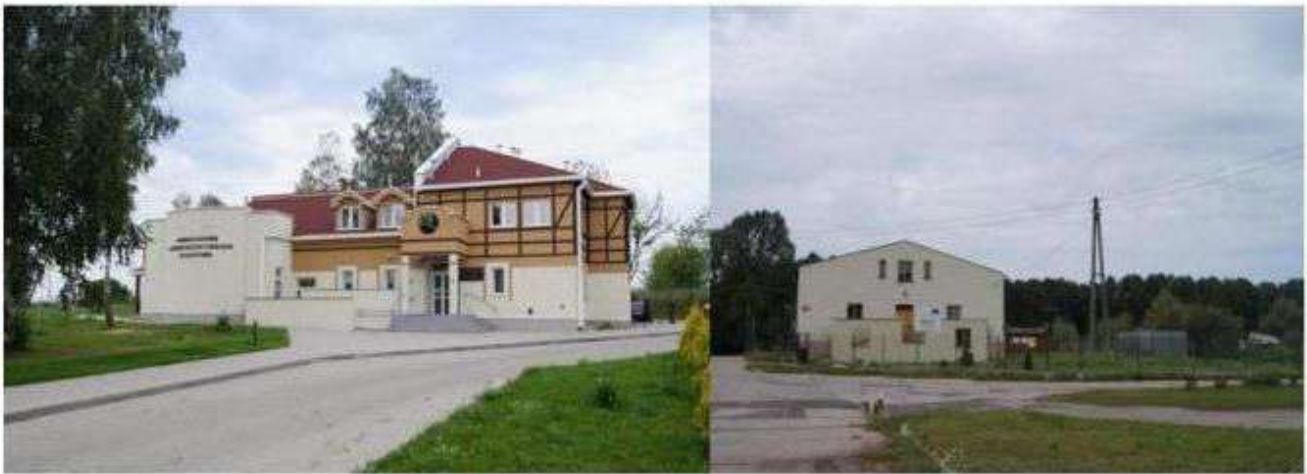
Centrum Kultury i Ekologii w Plichtowie

Wśród wymienionych historycznych układów ruralistycznych wśród historycznej i współczesnej zabudowy pojawiają się elementy świadczące o więziach mieszkańców z kulturą regionu w postaci ośrodków integracji społeczności lokalnej.