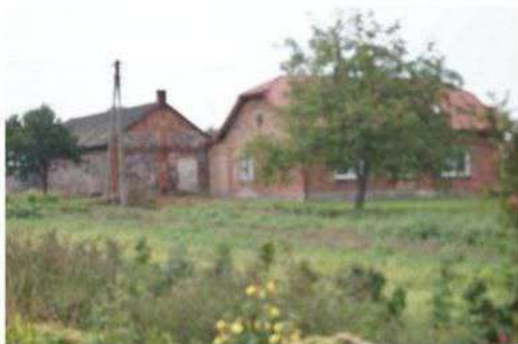
Nowe Skoszewy – tradycyjna zabudowa poniemieckich osadników

Przedwojenna architektura poniemieckich osadników stanowi charakterystyczny element krajobrazu kulturowego gminy Nowosolna. Są to budynki mieszkalne i gospodarcze zbudowane z kamienia, lub z kamienia i cegły, kryte dachówką ceramiczną.