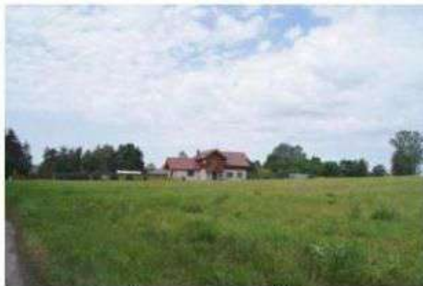
Stare Skoszewy - nowe osadnictwo

Nazwa gminy Nowosolna pochodzi od nazwy Neu-Sulzfeld - osady powstałej w 1802 roku, założonej przez kolonistów niemieckich. Po III rozbiórce Polski okolice Łodzi zostały objęte „kolonizacją fryderycjańską”. Zaborca pruski w sposób zorganizowany prowadził politykę osiedleńczą Nowosolnej i okolicznych terenów. Na obszarach dotąd nieużytkowanych gospodarczo zakładano wsie, w których osiedlano przeważnie Niemców. Wieś Neu-Sulzfeld zasiedlili ewangelicy pochodzący głównie z okolic wirtemberskiego miasta Sulzfeld. Z czasem nazwa uległa polonizacji w formie Nowosolna, która jest wolnym tłumaczeniem nazwy niemieckiej.