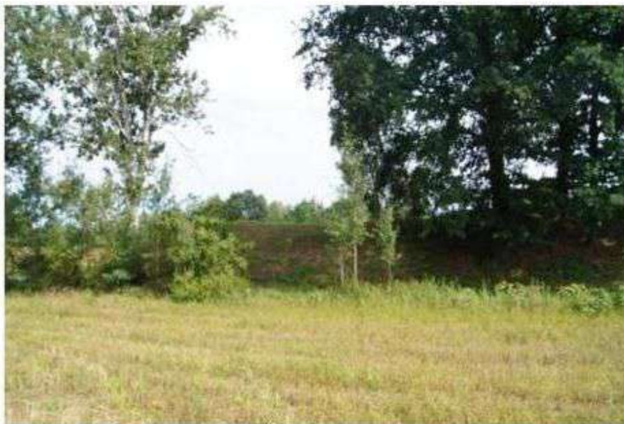
Widok na stanowisko archeologiczne nr 1 – Stare Skoszewy

Na terenach stref ochrony stanowisk archeologicznych wymagane jest sprawowanie nadzorów archeologicznych.