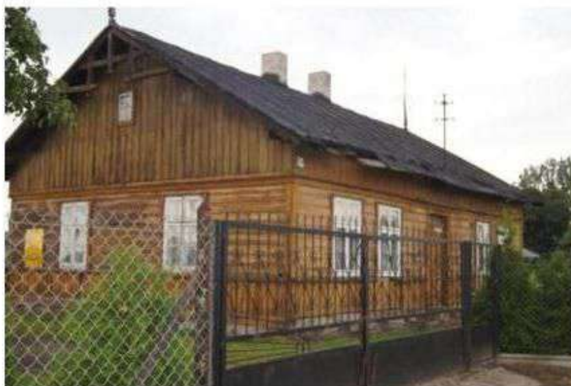
Wiączyń Dolny nr 31 – dom przeznaczony do rozbiórki z uwagi na zły stan techniczny