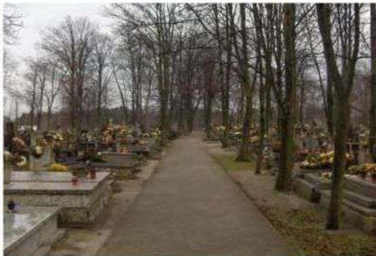
Stare Skoszewy – cmentarz grzebalny

W odległości 100 metrów na północ od kościoła znajduje się trzeci współczesny cmentarz grzebalny, na którym odnaleźć można m.in. pomnik nagrobny powstańca styczniowego z 1863 r. oraz mogiłę zbiorową żołnierzy poległych w czasie II Wojny Światowej.