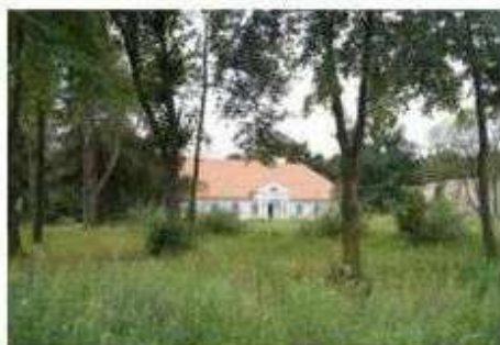
Byszewy – dwór

Ważnym elementem dziedzictwa kulturowego gminy Nowosolna z tego okresu są pozostałości dawnych posiadłości ziemiańskich. Do dziś zachowało się założenie podworskie w Byszewach i Starych Skoszewach. Przeprowadzona w latach późniejszych parcelacja gruntów, zabór powierzchni i budownictwo w bezpośrednim sąsiedztwie lub wręcz na terenie założenia podworskiego, doprowadziły do zatarcia ich pierwotnych granic i układów kompozycyjnych. Dwory w Byszewach i Starych Skoszewach przetrwały do dziś.