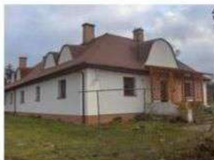
Stare Skoszewy – dwór