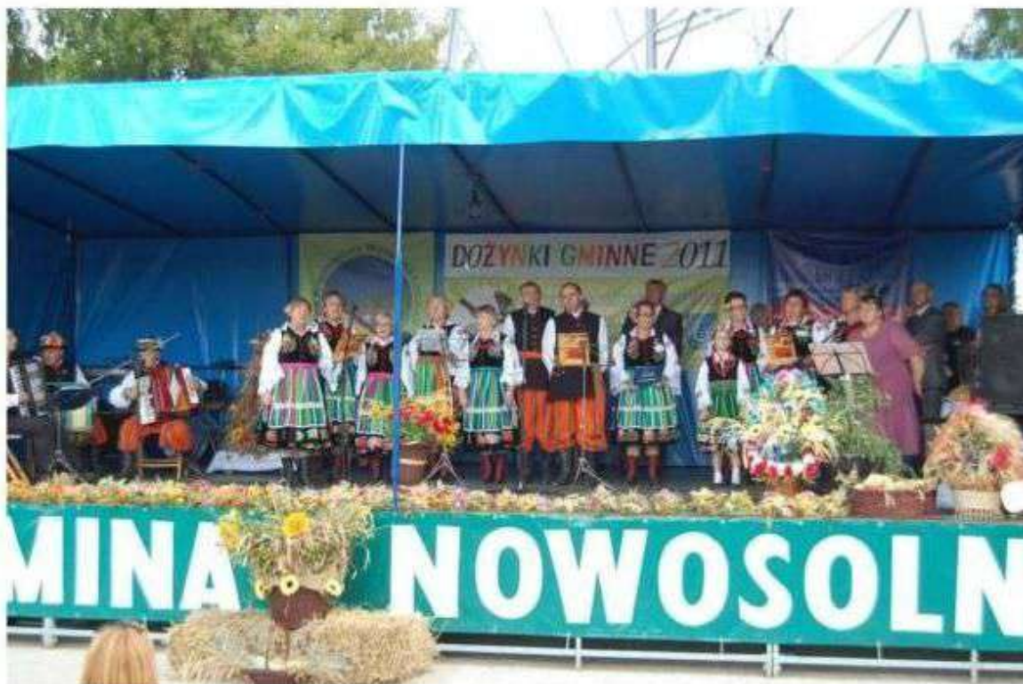
Organizacja imprez kulturowo – folklorystycznych - dożynki gminne

Organizacja imprez kulturowo– folklorystycznych - takich jak: Majówka Samorządowa czy Dożynki Gminne powoduje zwiększenie identyfikacji mieszkańców z kulturą regionu. Udział twórców i artystów z terenu gminy powoduje rozwój rzemiosła ludowego i wzmocnienie elementów etnograficznych. Odbywające się imprezy powinny być silnie promowane na terenie gminy i województwa.