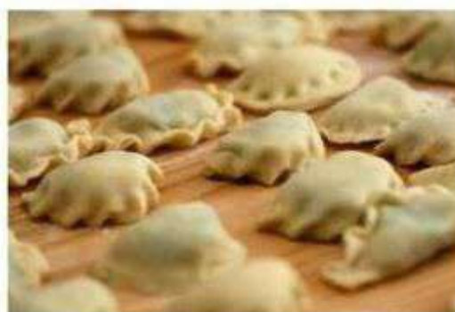
„żur skoszewski” oraz „moskiewskie pierogi”