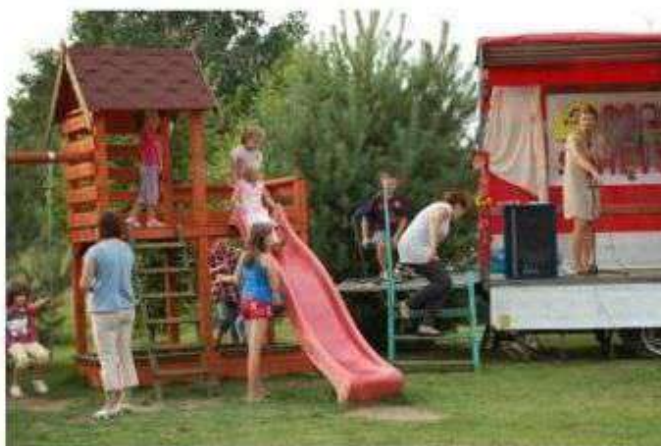
Tworzenie przestrzeni integrującej społeczność lokalną.

Należy kontynuować działania w celu ożywiania układów przestrzennych ośrodków ruralistycznych gminy Nowosolna z uwzględnieniem elementów społecznych procesu. Nowopowstała przestrzeń publiczna powinna być udostępniona lokalnej społeczności i wykorzystywana na funkcje kulturalne, turystyczne i społeczne.