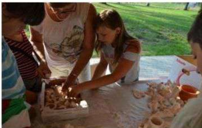
Warsztaty wypalania z ceramiki