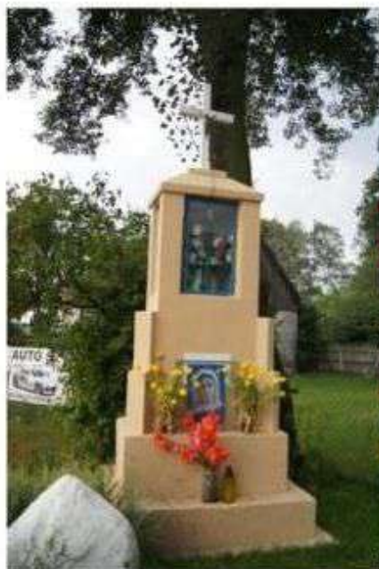
Wiączyni Dolny – kapliczka