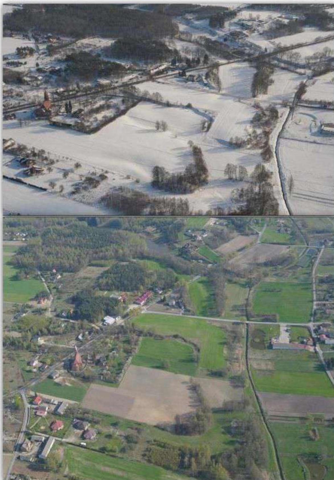
Stare Skaszewy - widok na grodzisko wczesnośredniowieczne i osadę