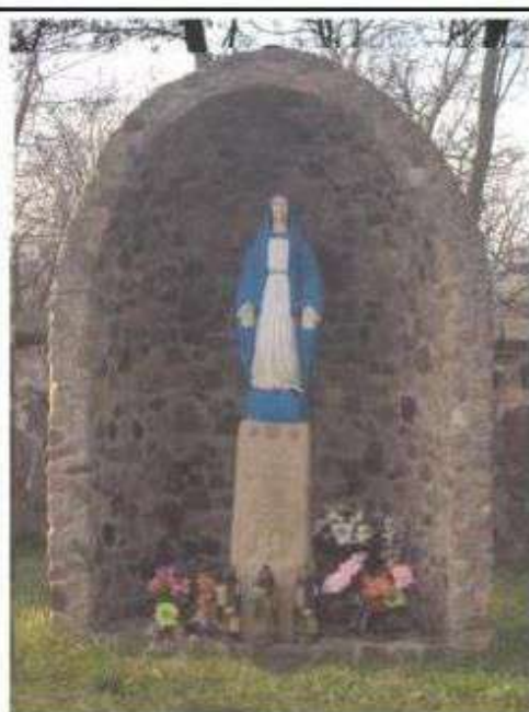
Stare Skoszewy - teren cmentarza przykościelnego