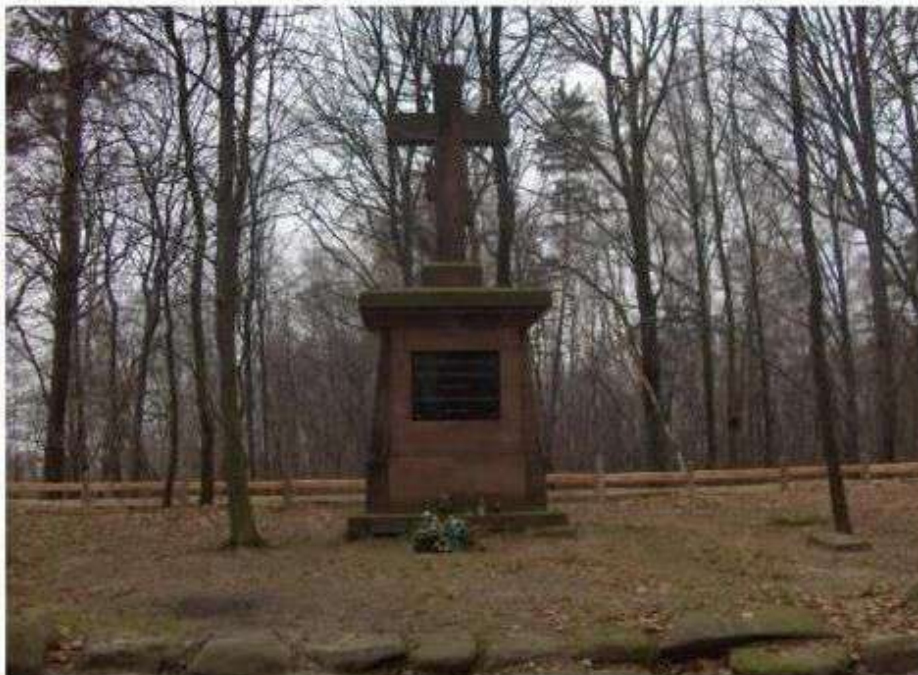
Wiączyń Dolny – cmentarz wojenny z czasów I wojny światowej