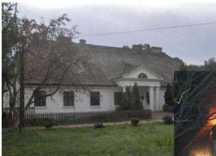
Byszewy – dwór przed pożarem

opisywany przez Iwaszkiewicza jako „mały kurhan”.