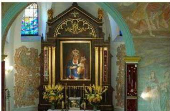
Altarz przed renowacją

W skoszewskim kościele znajduje się cudowny, słynący łaskami obraz Matki Bożej z Dzieciątkiem. Namalowany w drugiej połowie XIV w., prawdopodobnie wykonany w Rzymie na polecenie papieża Grzegorza Wielkiego. Wizerunek Matki Bożej może stać się pamiątką gminy Nowosolna.