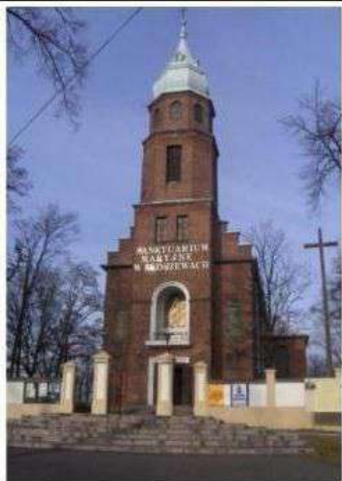
Stare Skoszewy - kościół