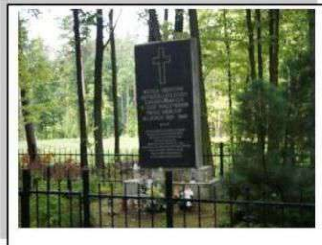
Teolin – miejsce pamięci