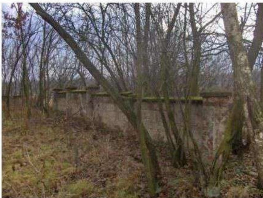
Stare Skoszewy (Głąbie) – cmentarz ewangelicki