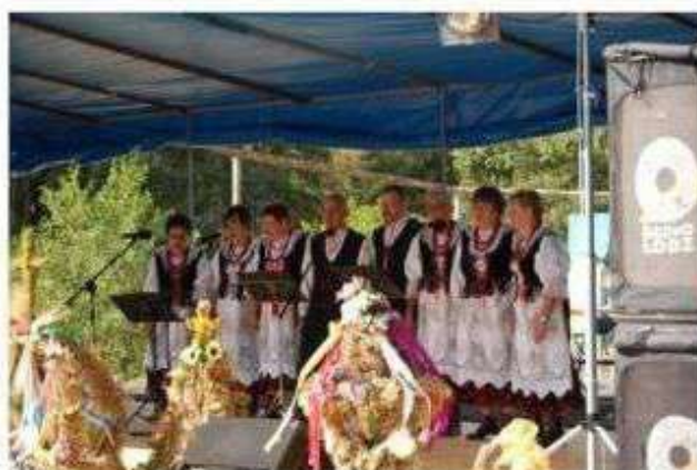
Zespół śpiewaczy Wiączynianka