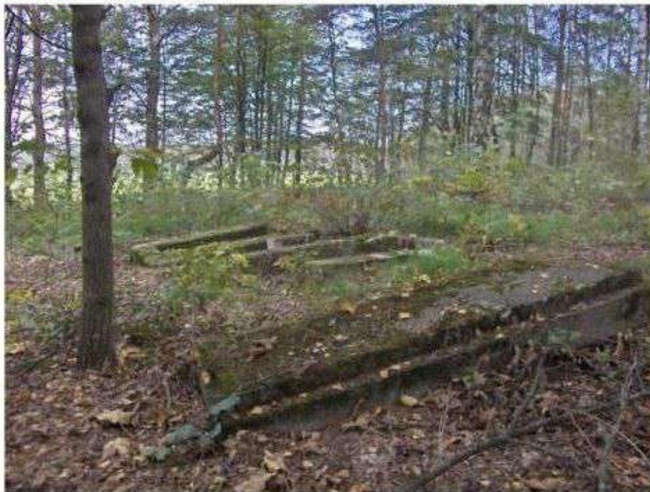
Cmentarz ewangelicki w Grabnie