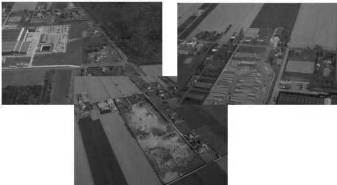
Widok na strefę działalności gospodarczej

W okolicy projektowanego zjazdu z autostrady i drogi krajowej, na terenie wsi Natolin i Teolin, położona jest ponad 100-hektarowa strefa przedsiębiorczości gminy, teren przeznaczony pod działalność gospodarczą, w której jest już zlokalizowanych kilka poważnych przedsięwzięć, a dalsze rozpoczynają inwestycje.