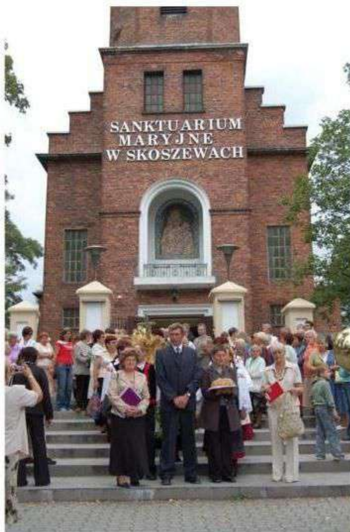
Sanktuarium w Starych Skoszewach

Sanktuarium Maryjne w Starych Skoszewach stanowi cenny walor do rozwijania turystyki pielgrzymkowej. Całościowy projekt powinien obejmować założenie sakralne w Starych Skoszewach oraz kapliczki z terenu gminy.