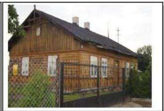
Wiączyń Dolny – dom