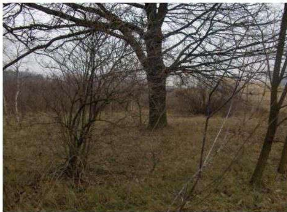
Teolin – cmentarz ewangelicki

Z wymienionych cmentarzy ewangelickich do najlepiej zachowanych należy założony na planie prostokąta - cmentarz ewangelicki z przełomu XIX i XX wieku w Głogowcu.