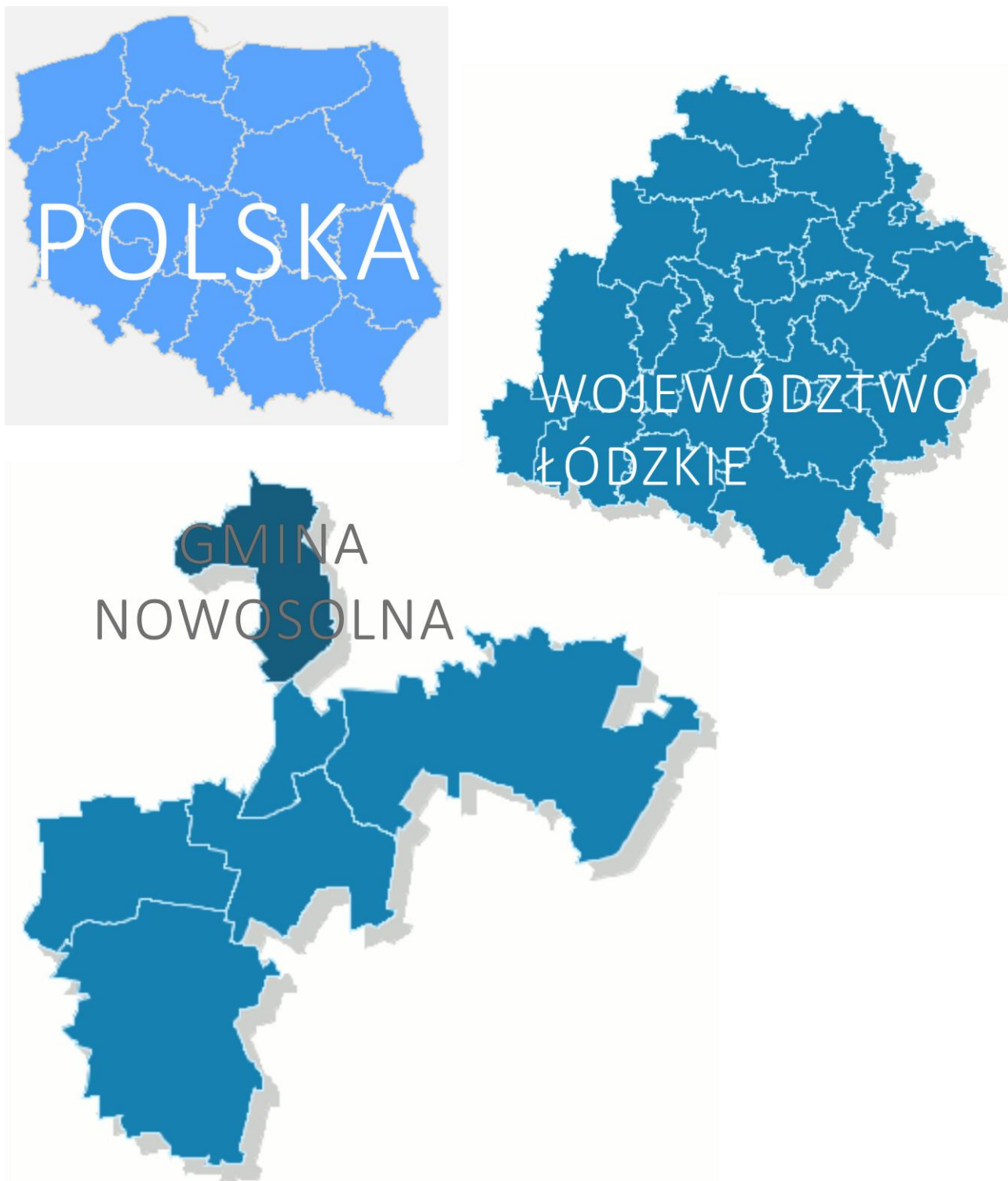
Rysunek 1. Teren gminy Nowosolna na tle powiatu, województwa i kraju, źródło: internet.

Wpływ na rzeźbę terenu miał także człowiek, podróżując przez te tereny przyczyniał się do wylesiania, a co za tym idzie powstania wąwozów, które przekształciły się w parowy. Najciekawsze w tym rejonie to Parowy Janinowskie i Parowy Brzezińskie.