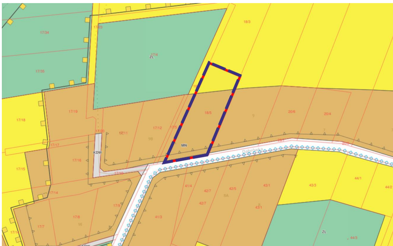
Rysunek 5. Obowiązujący miejscowy plan

fragment ciągu komunikacyjnego. Dojdzie do całkowitej zmiany przeznaczenia terenu w kierunku zabudowy mieszkaniowej jednorodzinnej oraz wraz z ciągiem komunikacyjnym.