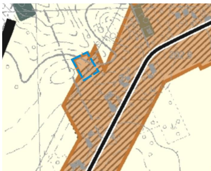
Rysunek 6. Obowiązujące studium

Krajowe dokumenty, które odgrywają nadrzędną rolę w planowaniu przestrzennym to Strategia Rozwoju Kraju 2020 czyli podstawowy dokument strategiczny określający cele i priorytety polityki rozwoju w perspektywie najbliższych lat oraz warunki, które powinny ten rozwój zapewnić. Stanowi on punkt odniesienia zarówno dla innych strategii opracowywanych przez jednostki samorządu terytorialnego. Z kolei Koncepcja Przestrzennego Zagospodarowania Kraju 2030 – to najważniejszy dokument dotyczący ładu przestrzennego Polski. Przedstawia on wizję zagospodarowania przestrzennego kraju w perspektywie najbliższych 20 lat. Wprowadza zasadę współzależności celów polityki przestrzennej z celami polityki regionalnej.