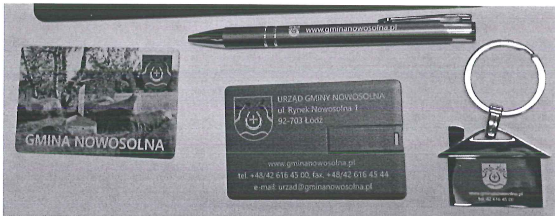
Gadżety promujące Gminę Nowosolna

W ramach realizacji niniejszego zadania zostały przygotowane przez Urząd Gminy Nowosolna gadżety z nazwą i herbem Gminy Nowosolna, propagujące dziedzictwo kulturowe gminy oraz reklamujące ten region. Stanowią one swego rodzaju promocję gminy oraz upowszechniają wiedzę o przynależności do wspólnoty terytorialnej i samorządowej, podkreślają więzi historyczne, kulturowe.