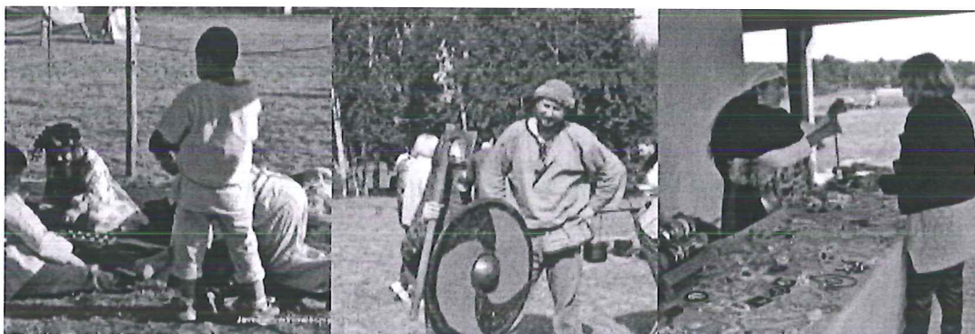
Noc Kupały i Jarmark Średniowieczny 20-21 czerwca 2015

umocnienie tożsamości mieszkańców gminy, integracja mieszkańców poprzez wspólne działania projektowe, promocję turystyczną obszaru, stworzenie cyklicznej atrakcji turystycznej, promocja lokalnych twórców ludowych, ich produktów i usług, których podstawę stanowią lokalne zasoby oraz zaznajomienie uczestników (głównie dzieci i młodzież) z dawnymi zawodami. Zadanie ma na celu przyczynienie się do wzmocnienia więzi społeczności lokalnej z miejscem zamieszkania, pobudzenie aktywności lokalnej oraz poszerzenie i wzbogacenie oferty spędzania wolnego czasu.