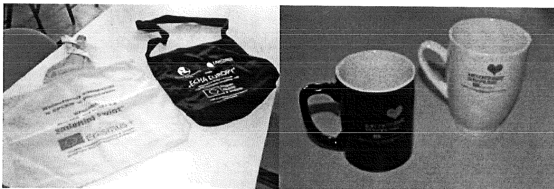
Artykuły promocyjne Wolontariatu Europejskiego

Gminno Parkowe Centrum Kultury i Ekologii w Plichtowie w ramach projektu Wolontariatu Europejskiego (program ERASMUS+ oraz program „Młodzież w działaniu”) zleciło przygotowanie artykułów promocyjnych tj. toreb płóciennych oraz kubków ceramicznych, promujących Wolontariat Europejski (EVS) oraz GPCCKiE w Plichtowie, jako jednostkę wysyłającą, koordynującą i przyjmującą wolontariuszy z różnych krajów Europy.