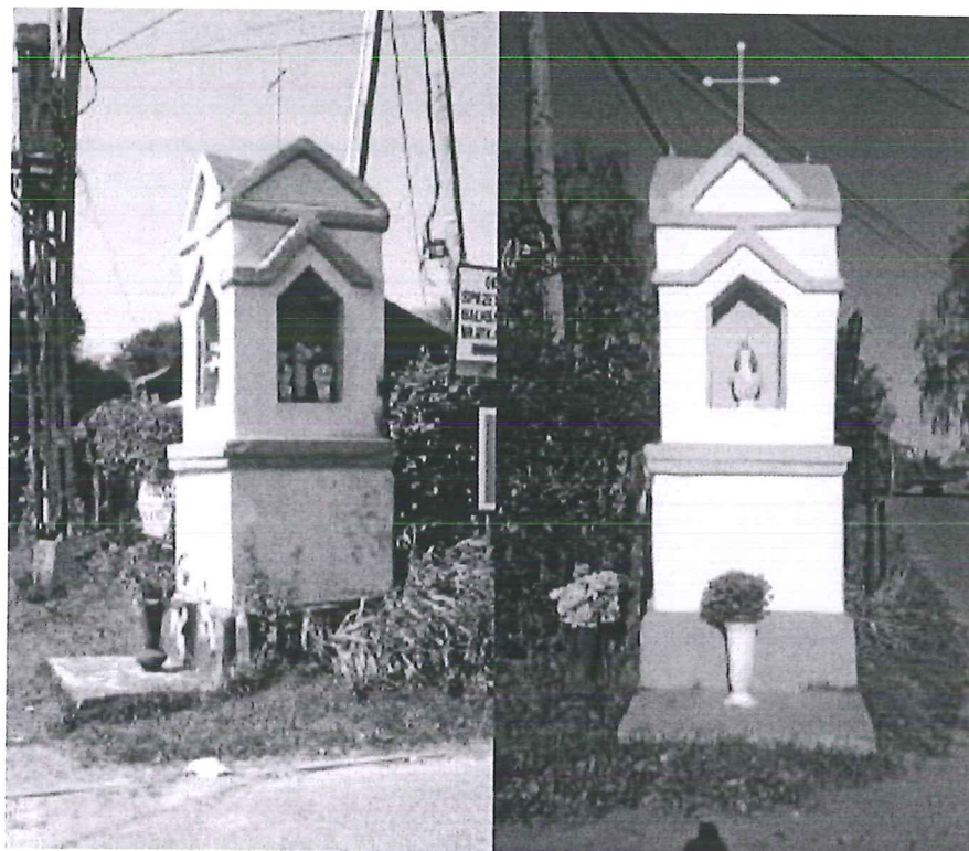
Kapliczka przydrożna w Kalonce

Prace remontowe zostały wykonane przez mieszkańców sołectwa w czynie społecznym, z ich środków własnych.