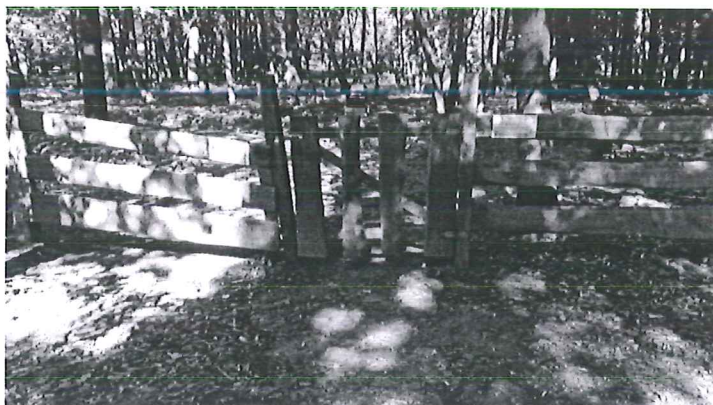
Uszkodzona brama i furtka cmentarza wojennego

Ze środków budżetu gminy na rok 2016 zlecono wykonanie prac polegających na demontażu uszkodzonej bramy wjazdowej i furtki na terenie cmentarza wojennego w Wiączyniu Dolnym oraz wykonanie nowej furtki i bramy jako dwuskrzydłowej, dla jej lepszej stabilności (koszt realizacji zamówienia 2.500,00 PLN).