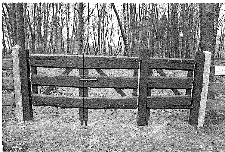
Wymieniona brama i furka cmentarza wojennego

W 2016 roku, miejsce pamięci narodowej zlokalizowane w Lesie Wiączyńskim, w miejscowości Teolin, zostało oczyszczone w celu jego uwidocznienie – wycięto młode zadrzewienia oraz usunięto spróchniałe drzewa zagrażające pomnikowi powstałemu ku czci pomordowanych.