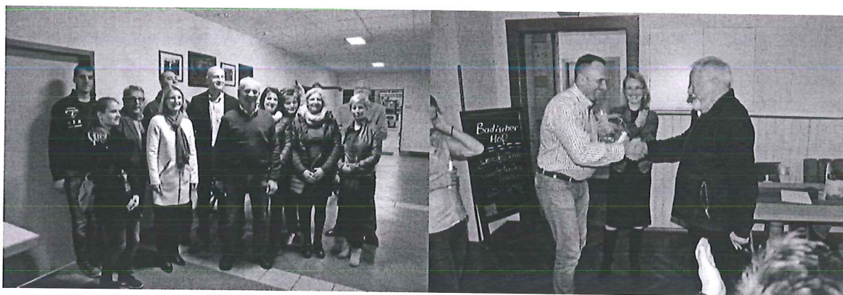
Wizyta partnerska w Sulzfeld – październik 2016 roku

W dniach 14-16 października 2016 roku delegacja składająca się z przedstawicieli gminy Nowosolna odwiedziła z wizytą roboczą gminę partnerską Sulzfeld w kraju związkowym Badenia – Witembergia, w powiecie Karlsruhe.