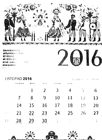
Kalendarz na 2016 rok

Celem wydania niniejszych kalendarzy jest m. in. promocja gminy i jej zasobów. Kalendarze były rozdawane przede wszystkim w środowisku lokalnym podczas imprez gminnych.