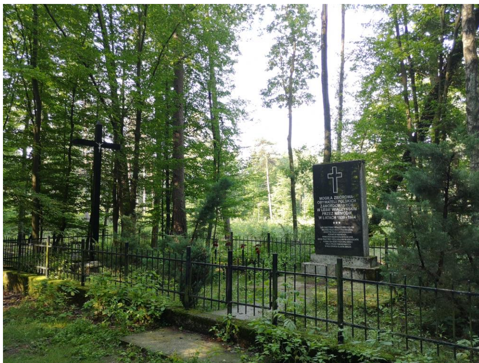
Miejsce pamięci na skraju Lasu Wiączyńskiego w Teolinie

Teren cmentarza zostaje poddany corocznym pracom porządkowym. Wykonuje się wówczas przegląd stanu ogrodzenia cmentarza, a w razie konieczności wymienia uszkodzone, drewniane elementy. Ponadto wykonywane są prace związane z pielęgnacją zieleni, tj. wykoszenie traw, a w okresie jesiennym oczyszczenie terenu cmentarza poprzez wygrabienie liści oraz pozbycie się gałęzi i innych odpadów.