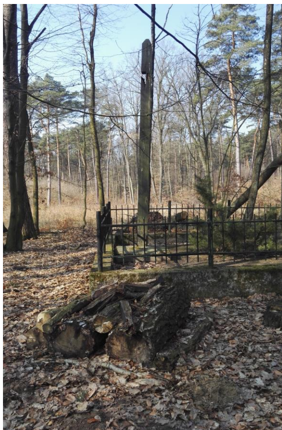
Uszkodzony, stary krzyż