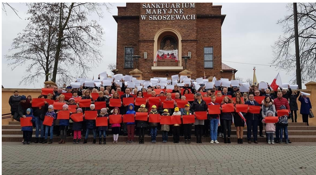
Fotografia mieszkańców Gminy Nowosolna podczas Święta Niepodległości w 2018 roku

Podstawowej w Strych Skoszewach, gdzie odbyła się część artystyczna poświęcona 100. rocznicy odzyskania przez Polskę Niepodległości.