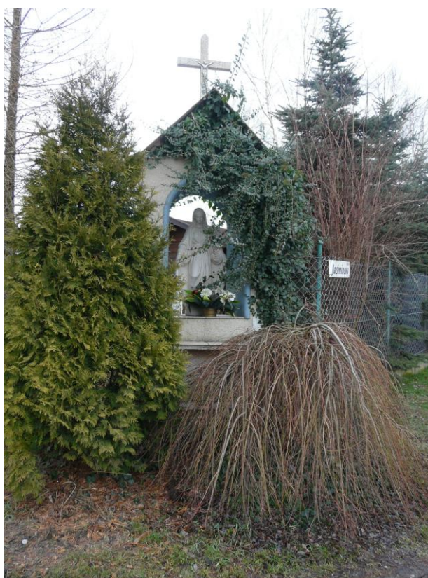
Kapliczka przydrożna w Kalonce

Konserwacją bieżącą przydrożnych krzyży i kapliczek zlokalizowanych na terenie gminy Nowosolna zajmują się mieszkańcy. W latach poprzednich staraniem Rady Sołeckiej Sołectwa Borchówka, ze środków Funduszu Sołeckiego, odrestaurowana została kapliczka w Dobieszkowie. W ramach przeprowadzonych prac wykonano: remont dachu, odnowiono elewację oraz wnętrze kapliczki, wykonano ogrodzenie z elementów metalowych oraz utwardzono kostką brukową teren wokół. Środki pozyskane z funduszu sołeckiego przeznaczono na materiały, natomiast prace remontowe zostały wykonane przez mieszkańców sołectwa w czynie społecznym. Staraniem i wysiłkiem mieszkańców Sołectwa Teolin oraz Sołectwa Stare Skoszewy, odrestaurowana została kapliczka przydrożna w Teolinie i w Starych Skoszewach przy ul. Malinowej. W ramach przeprowadzonych prac wykonano: remont dachu, odnowiono elewację oraz wnętrze kapliczki. Prace remontowe zostały wykonane przez mieszkańców sołectwa w czynie społecznym, z ich środków własnych.