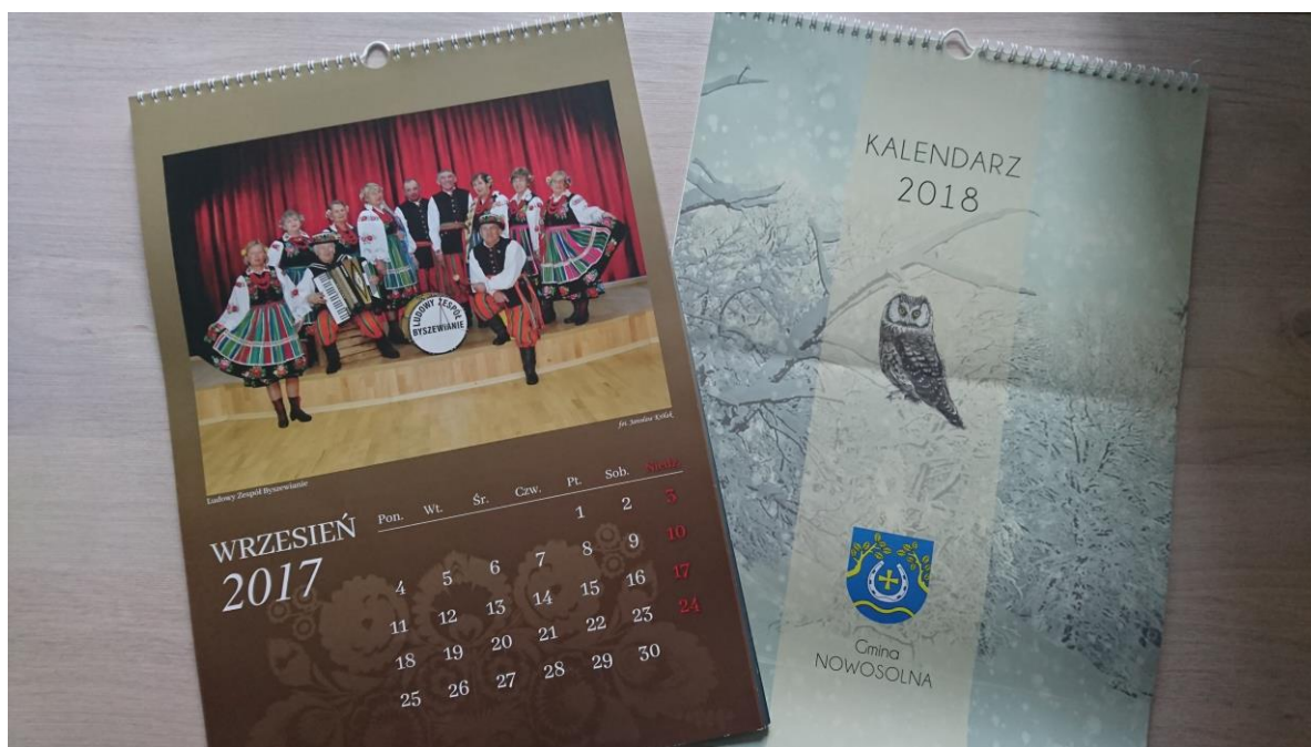
Kalendarze promujące Gminę Nowosolna

W ramach promocji zasobów i walorów dziedzictwa kulturowego w roku 2017 oraz 2018 roku także na zlecenie Urzędu Gminy Nowosolna zostały przygotowane kalendarze ściennie promujące kulturę Gminy Nowosolna oraz opatrzone licznymi kolorowymi fotografiami, dokumentującymi dziedzictwo kulturowe gminy Nowosolna. Celem wydania niniejszych kalendarzy jest m. in. promocja gminy i jej zasobów. Kalendarze były rozdawane w środowisku lokalnym podczas imprez gminnych i powiatowych.