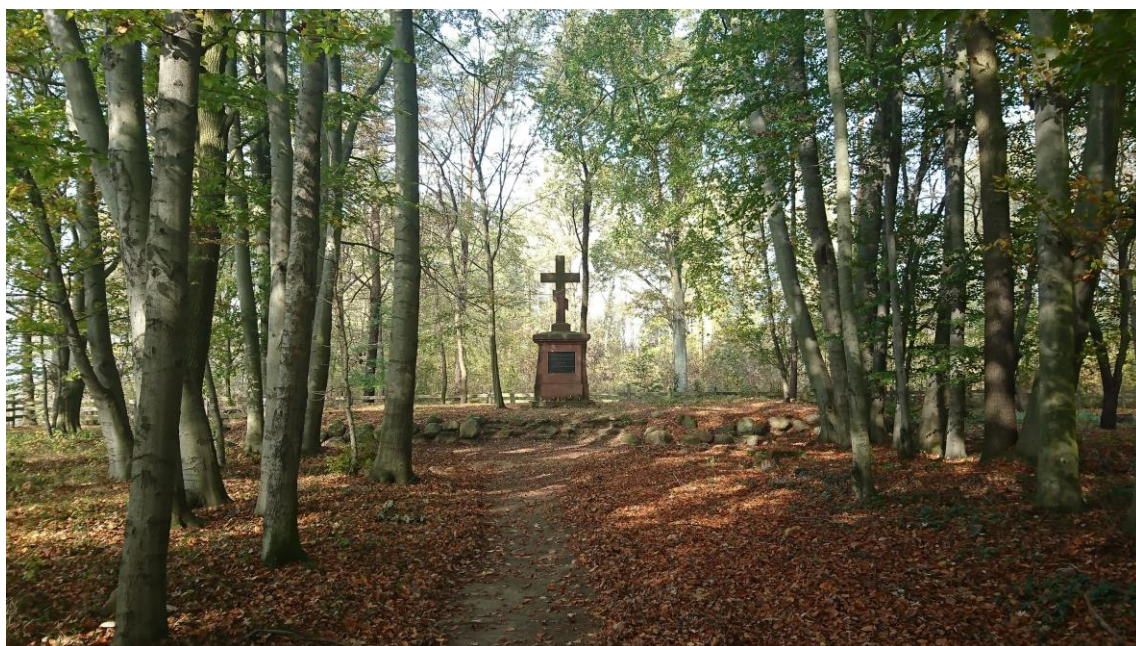
Mogila zbiorowa na cmentarzu wojennym w Wiączyńiu Dolnym

W 2018 roku ponownie złożono wniosek do Ministerstwa Kultury i Dziedzictwa Narodowego o przyznanie dofinansowania na wykonanie prac remontowo-konserwatorskich na cmentarzu wojennym z okresu I wojny światowej w Wiączyńiu Dolnym. Przewidywany budżet zadania w 2018 r. wynosił 126.000,00 PLN, zaś wnioskowana kwota dofinansowania wynosiła 100.000,00 PLN. Niestety ponownie nie uzyskano środków finansowych o które wnioskowano. Ponownie powodem negatywnej decyzji ministra był brak uzyskania odpowiedniej liczby punktów (62 pkt.).