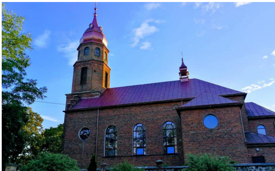
Sanktuarium Maryjne w Starych Skoszewach

Urząd Gminy Nowosolna zamierza, w następnym okresie sprawozdawczym, wystąpić do parafii rzymskokatolickiej pod wezwaniem Wniebowzięcia Najświętszej Maryi Panny w Starych Skoszewach, która sprawuje opiekę nad obiektami zabytkowymi, pozostającymi w jej władaniu, tj.: cmentarz parafialny, cmentarz przykościelny, kościół, plebania, murowane ogrodzenie kościoła, zabytki ruchome, z wnioskiem o rozważenie oraz podjęcie działań w celu wpisania kościoła i zachowanego zabytkowego ogrodzenia z kamienia naturalnego do rejestru zabytków województwa łódzkiego.