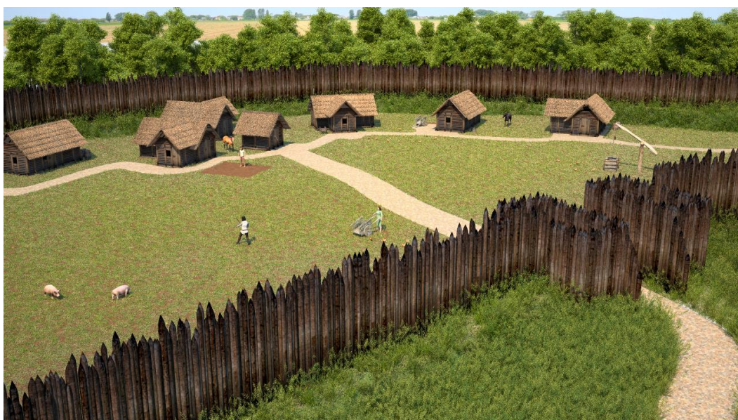
Cyfrowa rekonstrukcja grodziska w Starych Skoszewach