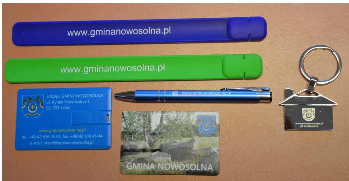
Gadżety promujące Gminę Nowosolna

W ramach realizacji niniejszego zadania zostały przygotowane przez Urząd Gminy Nowosolna gadżety z nazwą i herbem Gminy Nowosolna, propagujące dzieło kulturowe gminy oraz reklamujące ten region. Stanowią one swego rodzaju promocję gminy oraz upowszechniają wiedzę o przynależności do wspólnoty terytorialnej i samorządowej, podkreślają więzi historyczne i kulturowe.